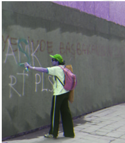
Resim 1. “Küfürle değil, inatla diren” eylemlerinden bir karede “AMK” duvar yazılamasını, “AŞK” olarak değiştiren kadın eylemci görülüyor.