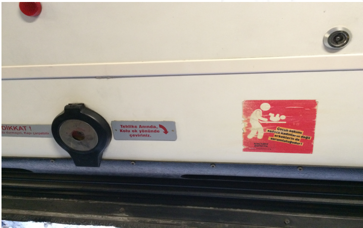
Resim 2. Kreş Haktır Platformu'nun hazırladığı, "Çocuk bakımı sadece kadınların değil erkeklerin de sorumluluğudur!" yazılı bir çıkartma. İstanbul'da bir halk otobüsünde çekilen bu fotoğraf, kent mekânlarının kadınlar açısından çelişkili yönü için güzel bir örnek teşkil etmektedir. Otobüsler bir yandan kadınlar için