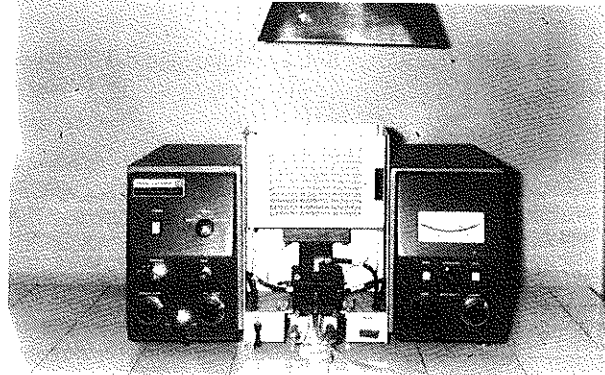
Resim 2. Atomik Absorbsiyon Spektrofotometresi

Ayrıca deney sonuçlarımızı karşılaştırabilmek amacıyla, deneye girmemiş, normal laboratuvar koşullarında yetişmiş yaklaşık iki aylık, 14 adet ratın alt çeneleri çıkarılarak 1., 2. ve 3. molar dişlerinin kalsiyum miktarları aynı yöntemle belirlendi.