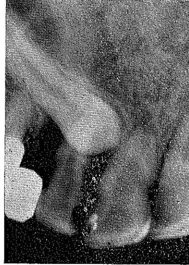
Resim : 2 — Üst sağ sürekli kanin dişinde edememiş, gömük kalmış. Kaninin boşluğunu kapatmak için bir köprü yapılmış.

Bu yazıda takdim edilen vak'a çok ender görülen ikinci tipte olduğundan enteresan bulunmuştur.