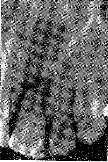
Resim : 1 — Üst sol orta keser diş. Pulpa boşluğu kökün ortasına kadar tamamen tıkalı. Kökün ortasında küçük bir boşluk var, kökucuna doğru inceleerek devam ediyor. Kök ucunda geniş bir periapikal lezyon görülüyor.

Travma tesiriyle pulpasında kireçlenme olan dişlerin tedavisi iki şekilde yapılır. Ekseriya pulpa odası ve kök kanalı oldukça daraldığı halde, kuronda kavite açarak kanal dolgusu yapmak mümkündür. Kanalı genişletmek için %10 luk «ethylenediamine tetra-acetate» «EDTA» solüsyon kullanılabilir (12). Bazı vak'alarda ise, pulpa odası tamamen tıkanmıştır, normal yoldan kanal tedavisi yapmak mümkün değildir; Cerrahi müdahale ile kök ucunda «redograd» dolgu yapılır (2).