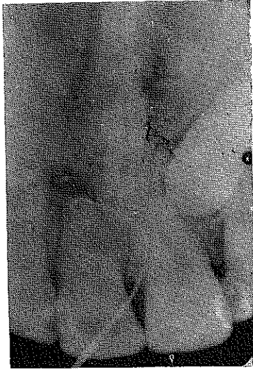
Resim : 3 — Miller Sondasının ucu, kök ucundan kanal boşluğuna girmiş halde.

Yapılan vitalometrik kontrolde, diş hiç reaksiyon göstermedi. Kalan çok az pulpa da nekroze idi.