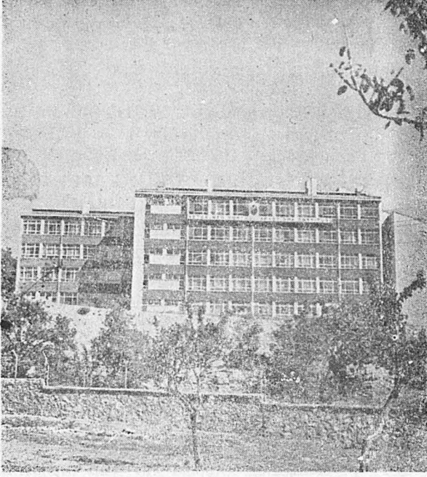
Enstitünün cepheden görünüşü.