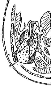
Resim 4 : Yarım şema. Alt dişlerden kaynağını alan infeksiyonların yayılışı. 1. Perimandibüler, 2. Submandibüler, 3. Yanak ve boyuna, 4. Sublingual, 5. Vestibüler. Oklar yayılma yönlerini gösteriyor.