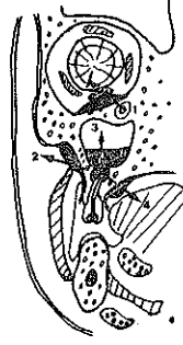
Resim 2 : Yarım şematik. Üst dişten kaynaklı infeksiyonun yayılışı. 1. Gömük kanın dişi ve ondan kaynağını alan infeksiyonun orbitaya yayılışı, 2. Vestibüle ve yanağa yayılma, 3. Sinus maxillaris yayılma, 4. Damağa yayılma. Oklar infeksiyonun yayılma yönlerini göstermektedir.