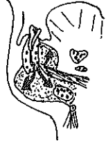
Resim 3 : Alt çene dişlerinden kaynağını alan infeksiyonların submandibular ve sublingual loja yayılışı.