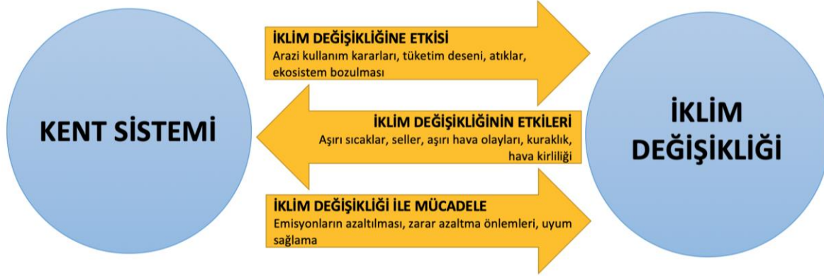
Şekil 1. İklim değişikliği ile kentler arasındaki sebep-sonuç-mücadele ilişkisi

Şehirlerin ekonomik ve politik faaliyetlerin merkezi olması iklim politikası üzerine yapılan tartışmalarda kentleri odak haline getirmiştir. C40 Büyük Kentler İklim Liderlik Grubu gibi oluşumlar sayesinde iklim değişikliğinin kentler üzerindeki etkisi ve kent ölçeğinde emisyon azaltma eylemleri tartışmaların yaygınlaşmasını ve kabul görmesini sağlamıştır. Kentler sahip oldukları altyapı olanakları, maliyet etkinliği yüksek alanlar olması ve uygulanabilir çözümler üretilmesine fırsat vermesi sayesinde iklim değişikliği zararlarını azaltma ve uyum sürecini kolaylaştırma fırsatlarını yaratabilmektedirler.