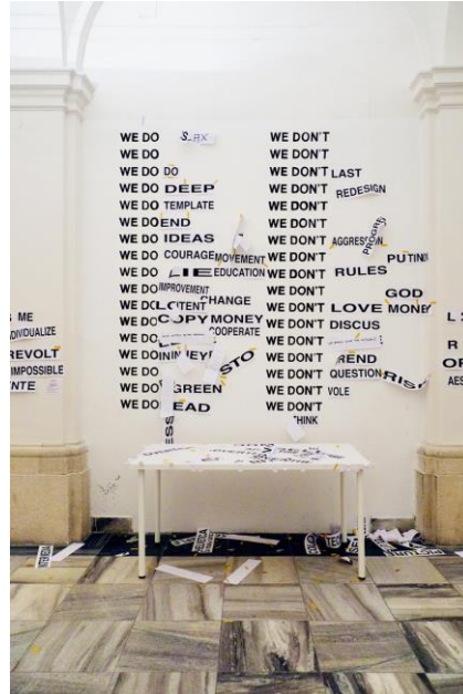
Görüntü 5. Sergileme tasarımı örneđi [21] (Figure 5. Exhibition design example)

Brno'daki grafik tasarım, eğitim ve okulların ele alındığı 26. Uluslararası Grafik Tasarım Bienalinde kapalı programlarda tartışma, kurallar ve bozulmalar tipografik bir düzenleme ile izleyicisine aktarılmaktadır (Görsel 5). Mesaj açık, anlaşılır ve hiyerarşik bir düzen içinde hedef kitlesi ile buluşmaktadır.