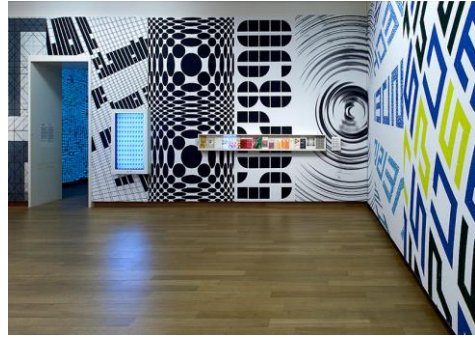
Görsel 2. Sergileme tasarımı örneđi [18] (Figure 2. Exhibition design example)

Sergileme mekanlarında izleyici mekanla sürekli etkileşim halindedir. Tasarımcı yaratıcı uygulamaları ile bu bađı güçlendirerek izleyicisini olayın içinde canlı tutmayı sağlamalıdır. New York'taki Industria Superstudio'da 'Exhibitionism-Rolling Stones' sergisi için hazırlanan çalışma Rock 'n' Roll Band adı verilen grubunun 50 yıllık kariyerini bir dizi tematik enstalasyon aracılıđıyla izleyicisine sunmaktadır (Görsel 3). Siyah beyaz renklerden oluşan seri tasarımı tipografi ve görüntünün birleşimi görsel bir etki uyandırmaktadır.