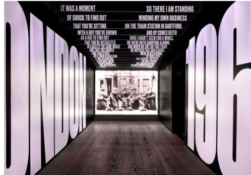
Görsel 3. Sergileme tasarımı örneđi [19] (Figure 3. Exhibition design example)

Sergileme mekanlarında izleyici mekanla sürekli etkileşim halindedir. Tasarımcı yaratıcı uygulamaları ile bu bađı güçlendirerek izleyicisini olayın içinde canlı tutmayı sağlamalıdır. New York'taki Industria Superstudio'da 'Exhibitionism-Rolling Stones' sergisi için hazırlanan çalışma Rock 'n' Roll Band adı verilen grubunun 50 yıllık kariyerini bir dizi tematik enstalasyon aracılıđıyla izleyicisine sunmaktadır (Görsel 3). Siyah beyaz renklerden oluşan seri tasarımı tipografi ve görüntünün birleşimi görsel bir etki uyandırmaktadır.