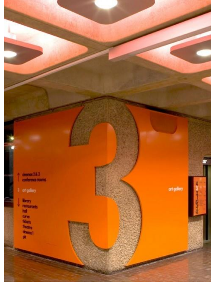
Görüntü 6. Sergileme Tasarımı Örneđi [22] (Figure 6. Exhibition Design Example)

tipografik uygulamaları, mekan içinde parlak turuncu renk kombinasyonu ve modern yazı karakteri çarpıcı ve dikkat çekici bir atmosfer yaratmaktadır (Görsel 6). Yön bulmada rehberlik eden ve görsel etki uyandıran tasarımda kullanılan tipografi binanın altı görülecek biçimde kesilerek ön plana çıkarılmıştır. Dolayısıyla kurumsal bir dil birliđi içinde ziyaretçilere rehberlik eden ve doğru yönlendiren bilgilendirme tasarımları sanat galerilerinde önemli hale gelmektedir.