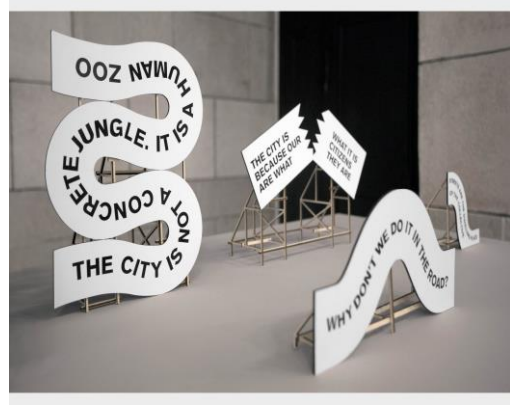
Görüntü 4. Sergileme tasarımı örneđi [20] (Figure 4. Exhibition design example)

Brno'daki grafik tasarım, eğitim ve okulların ele alındığı 26. Uluslararası Grafik Tasarım Bienalinde kapalı programlarda tartışma, kurallar ve bozulmalar tipografik bir düzenleme ile izleyicisine aktarılmaktadır (Görsel 5). Mesaj açık, anlaşılır ve hiyerarşik bir düzen içinde hedef kitlesi ile buluşmaktadır.