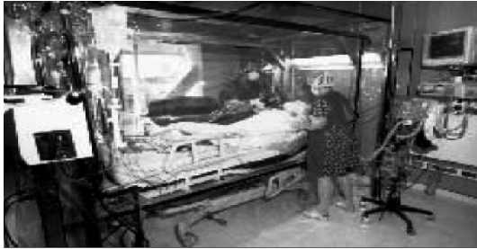
Şekil 2. Bakteri Kontrollü Hemşirelik Ünitesi

Bakteri kontrollü hemşirelik ünitelerinin, çapraz infeksiyonları önlemede etkili olabileceği belirtilmektedir. Etrafı plastik malzeme ile çevrili bu üniteler, laminar hava akımlı, sıcaklığı 84-88 0F ve nem oranı %80 olan sistemlerdir. Şiddetli yanığı olan çocuklarla, bakteri kontrollü hemşirelik ünitelerinde, beş yıllık süreçte yapılan bir çalışmada, çapraz infeksiyon oranı %7.6 olarak belirlenmiştir (Weber, Sheridan, Schulz, Tompkins ve Ryan 2002).