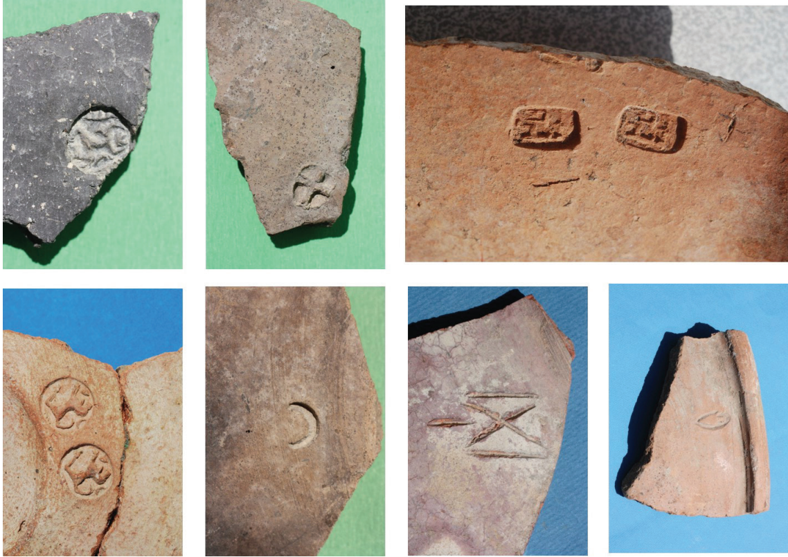
Fotoğraf 4- Ayanis Kalesi'nden çömlekçi işaretleri (Erdem 2013: Fig. 14).

Sonuç olarak, Ayanis sitadeli ve dış kenti arasında kurulan sosyo-ekonomik ilişkilerin niteliğini arkeolojik veriler üzerinden kısmen kurgulamak mümkündür. Bu ilişkilerin temelini, Ayanis ve çevresinin başlıca geçim kaynağını oluşturan tarım ve hayvancılık oluşturmaktadır. Sitadel ve dış kent arasında tarım ve hayvancılık ekonomisi üzerinden kurulan simbiyotik ilişki ağının, farklı etnik gruplardan oluşan kent sakinlerini bir arada tutan temel dayanaklardan biri olduğu söylenebilir.