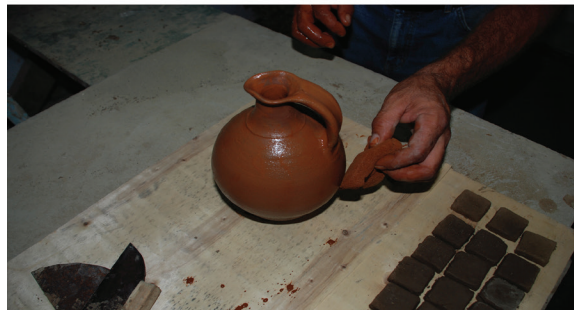
Fotoğraf 4- Yeniden üretilen yonca ağızlı bir Urartu testisini şekillendirme ve astarlama.