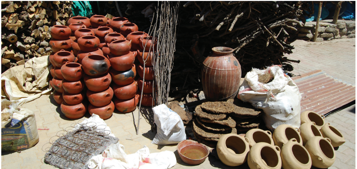
Fotoğraf 2- Bitlis/Kavakbaşı Köyü'nde seramik üretim faaliyetleri gerçekleştiren bir ev-atölyenin bahçesi.

köyün seramikleri ile Urartu seramikleri arasında bir kaç ortak form benzerliği dışında bir ilişki yoktu (Fotoğraf 1, 4). Bu nedenle ustanın Urartu formlarına aşina olması ve Urartu formlarını başarılı bir şekilde şekillendirmeye başlaması biraz zaman alacaktı.