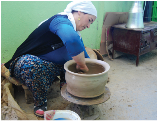
Fotoğraf 6- Kavakbaşı'nda bir ev-atölyede kap şekillendiren kadın.

Bu arada Bitlis'te ziyaret edilen Kavakbaşı ve Günkırı köylerinin kadınlar tarafından gerçekleştirilen ev tipi üretim (Fotoğraf 2, 6) faaliyetleri hakkında önemli bilgiler edinilmişti. Bu yıllarda killerden alınan örnekler, bu killerden hazırlanmış ve pişirilmiş deneme plakalarından ve Urartu seramiklerinden alınan örnekler laboratuvarında çeşitli analizlere tabi tutularak karşılaştırıldı (Batmaz - Özkan 2017).