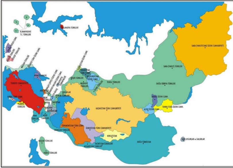
(Harita: Türk Dünyası:

cuttur. Türk Dünyası bugün sadece yedi bağımsız Türk devletinden oluşmamaktadır. Bağımsız devletler bu coğrafyanın sadece %43.7'sini kapsamaktadır. Geri kalan %56.3'lük coğrafya ise ağırlıklı olarak Rusya ve Çin'in içerisindeki özerk ve özerk olmayan Türk yurtlarını kapsamaktadır (Erol, 2018: 329-330). Yani Türk Dünyası; bağımsız ülkeler, özerk ülkeler ve Türk nüfus toplulukları olarak üç gruba ayrılmakta ve oldukça geniş bir coğrafyayı tanımlamaktadır. Türkiye ve Azerbaycan dışında, Hazar Denizi'nin ötesindeki beş bağımsız devleti tanımlamak için kullanılan Batı Türkistan uzun yıllar Rus işgalinde kalmış ve bu bölgedeki devletler ancak 1991'den sonra bağımsızlıklarını kazanmışlardır. Doğu Türkistan ise Sincan-Uygur Özerk Bölgesi adıyla Çin yönetimi – ki işgali altında demek daha doğru görünmektedir – bulunmaktadır. Bunların dışında Rusya Federasyonu ve bazı ülkelerde de Türk Cumhuriyetleri varlıklarını devam ettirmektedir (Doğanay, 1995: 32-33).