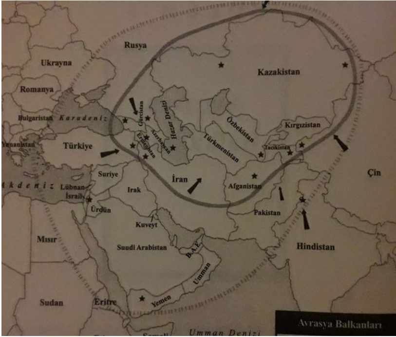
Harita: Avrasya Balkanları, (Brzezinski, 2016: 176)

Avrasya'nın önemli bir kısmı olan Orta Asya bölgesinde ABD'nin stratejik olarak iki hedefi olduğunu söylemek mümkündür. İlk olarak küresel güç mücadelesinde başat güc konumunu koruma amacıyla bölgedeki Rusya ve Çin'i kontrol etmek ve bu ülkelerin bölgedeki etkinliğini azaltmak, ikinci olarak ise Orta Asya bölgesinin zengin enerji kaynaklarına kolay bir ulaşım sağlamaktır. Bu iki etken ABD'nin buradaki politikalarına yön veren temeldir, diğer politikaları ise bu iki temelin türevleridir (Kireççi, 2011: 34). Enerji kaynaklarının küresel piyasaya sorunsuz bir şekilde akışının sağlanması ve bölge ülkelerinin serbest piyasa sistemini benimsemeleri konusu ABD'nin bölgedeki yaşamsal çıkarları arasındadır. 2000'li yıllardan itibaren ise, Erhan'ın atıf yaptığı Jim Nichol'un, " Central Asia's Security: Issues and Implications for US Interest " adlı çalışmasında olduğu gibi ABD'nin çıkarlarının sadece ekonomik olmadığını savunan görüşler artmaya başlamıştır. Bu görüşlerde Orta Asya'nın jeopolitik önemi vurgulanmış, ABD'nin bölgedeki diğer rakipleri olan Rusya, Çin ve Hindistan'ın bölgedeki etkilerini dengele-