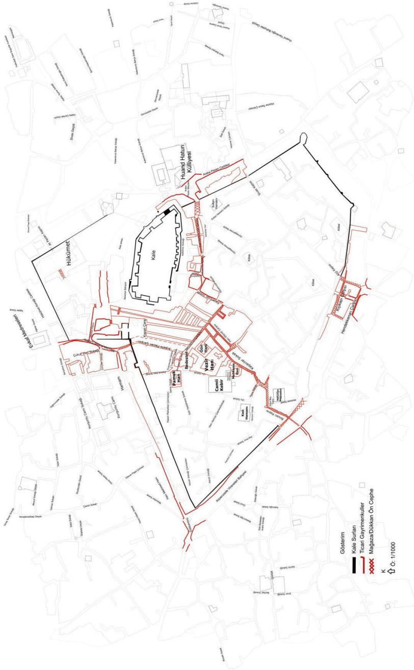
Şekil 3. Ticari Gayrimenkullerinin Mekânsal Dağılımı