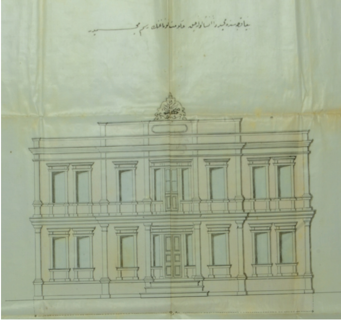
Resim 1. Biga'da Yapılacak Hükümet Konağı Resmi 59

Böylece, aşağıda resimleri görülen binalardan yalnızca hükümet konağı yapılmış, diğer binalar ise tamamlanamamıştır. Ancak hükümet konağının inşasına da hemen başlanamayacaktır. Çünkü Biga'yı yeni bir yangın felaketi beklemektedir.