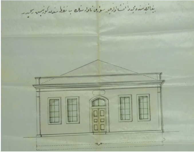
Resim 2. Biga'da İnşa Olunacak Süvari Ahır Resmi 60