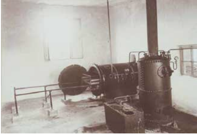
Resim 1: Etüv Makinesi 219