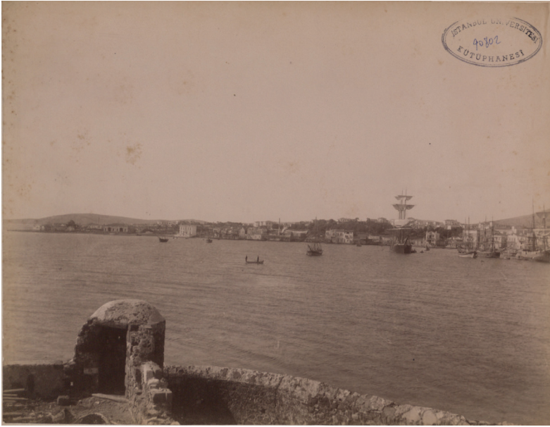
Resim 1: Sakız Adası'nın denizden görünümü. 6

Batı Anadolu kıyısındaki Çeşme kazasının tam karşısında ve 13 km açığında, 841 km 2 lik bir alana sahip olan Sakız Adası, coğrafi konumu gereği eski dönemlerden beri ticari ve askeri bir öneme sahipti. 1566-1913 yılları arasında Osmanlı hâkimiyetinde kalan ada, fetihten sonra Kapudan Paşa eyaletine sancak olarak bağlanmıştı. 1880-1887 tarihleri arasında yani yıkıcı depremin yaşandığı dönemde Sakız sancağı, Cezâyîr-i Bahr-i Sefid vilayetinin merkezi konumundaydı. Cezâyîr-i Bahr-i Sefid vilayeti, İstanköy, İpsara, Karyot, Leryoz, Kalimnoz kazalarından oluşan Sakız sancağının yanı sıra Rodos, Midilli, Sisam ve Kıbrıs sancaklarını kapsamaktaydı 4 . Vali Sadık Paşa'nın verdiği bilgilere göre depremin yaşandığı sırada adada Sakız kentinin yanı sıra 59 köy bulunmaktaydı. Bu köyler, mastaki (sakız), dağ ve ova köyleri olmak üzere üç gruba ayrılmıştı 5 .