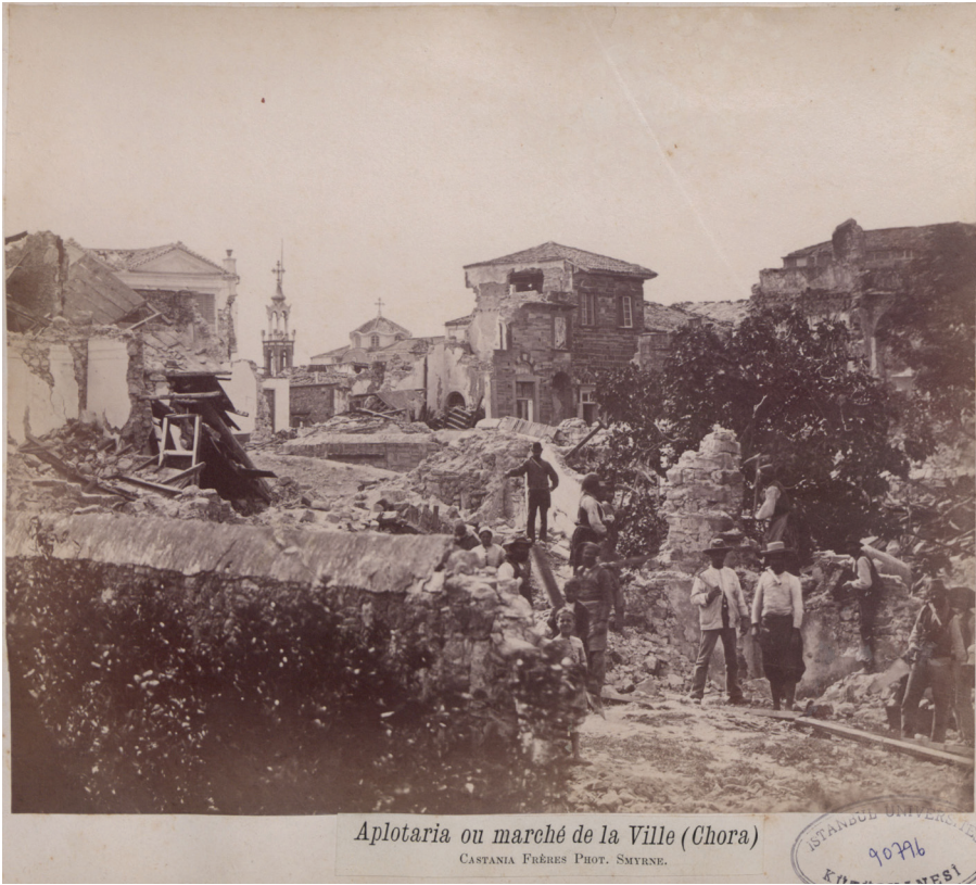
Resim 2: 1881 Depremi sonrasında Chora Köyü. 10