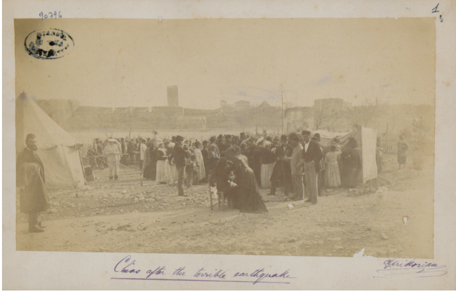
Resim 3: 1881 Sakız depreminde açıkta kalan afetzedeler. 12