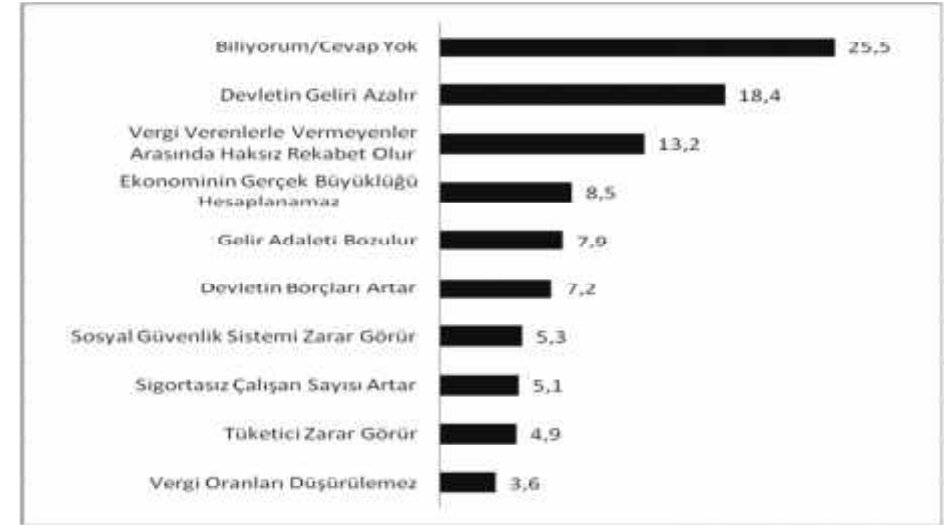
Grafik 2 : Kayıt Dışı Ekonominin Etkileri

Kaynak: (Gelir İdaresi Başkanlığı, 2009, 35)