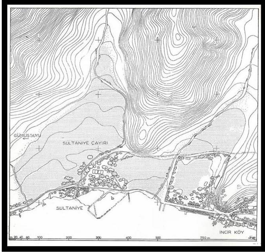
Ek 4: Hakkı Eldem'dem tarafından yapılan Sultaniye Bahçesi krokisi (Türk Bahçeleri, s. 16)