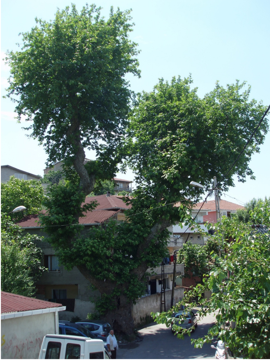
Ek 10: Ayios Eostantinos Ayazmasının yanındaki ulu ınar