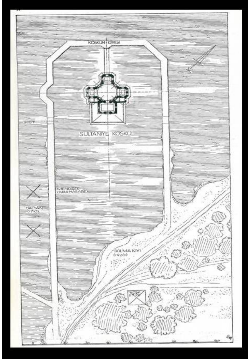
Ek 3: Hakkı Eldem'dem tarafından yapılan Acem Köşkü krokisi (Türk Bahçeleri, s. 14)