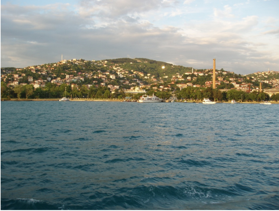
Ek 7: Günümüzde Sultaniye'nin deniz tarafından görünüşü