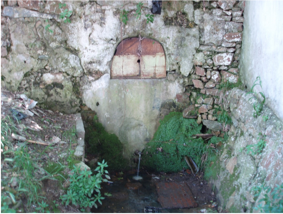
Ek 9: Ayios Eostantinos Ayazması