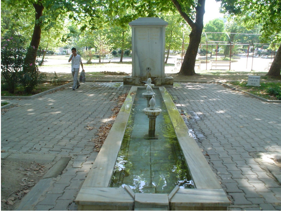
Ek 11: Mehmed Bey Çeşmesi