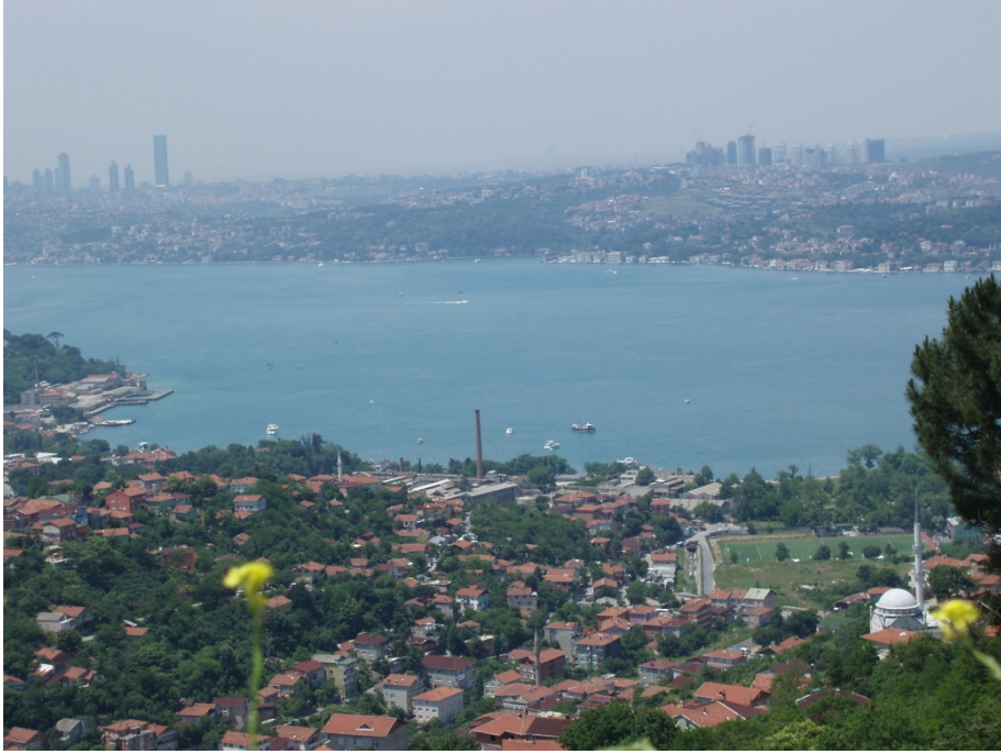
Ek 8: Günümüzde Sultaniye'nin doğudan (Karlıtepe'den) görünüşü