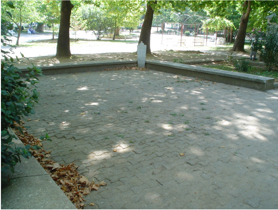
Ek 12: Namazgâh