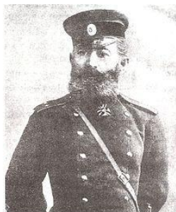
Самед-Бек Садых-Бек оглы Мехмандаров (1855-1931) - генерал от артиллерии Русской императорской армии, министр обороны Азербайджанской Демократической Республики (1918-1920)