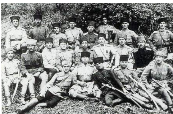
Офицеры армии АДР. Гянджа. 1918