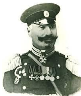
Алиага Исмаил Ага оглу Шихлинский (1865-1943) - Генерал-лейтенант старой русской армии, прозванный «Богом артиллерии» и Азербайджанской Демократической Республики