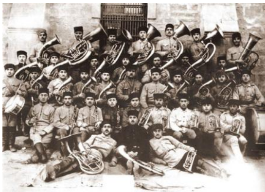
Оркестр армии АДР