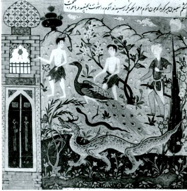
Resim 3- Hz. Âdem ve Havva. Kıyas-ı Enbiyâ , Topkapı Sarayı Müzesi Kütüphanesi, B. 250, vr. 36a.