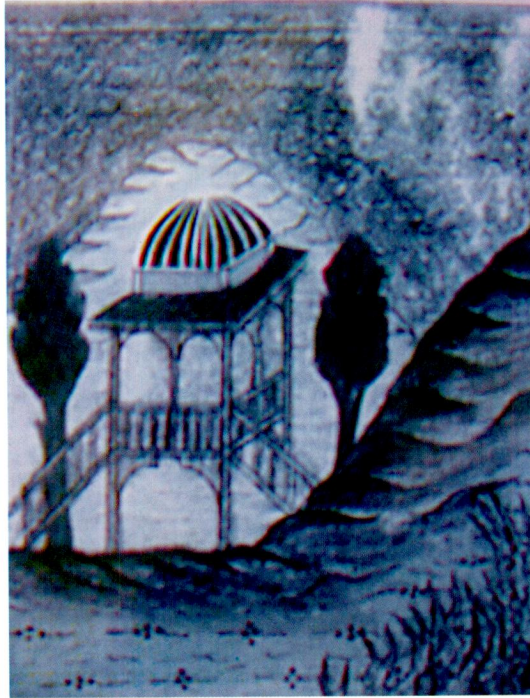
Resim 13- Deccal cenneti ve ateşi. Bistâmi, Ed-Durru'l-Munazzam fi Surri'l-İsmi'l-A'zam , Chester Beatty Library, 444, vr. 203b.