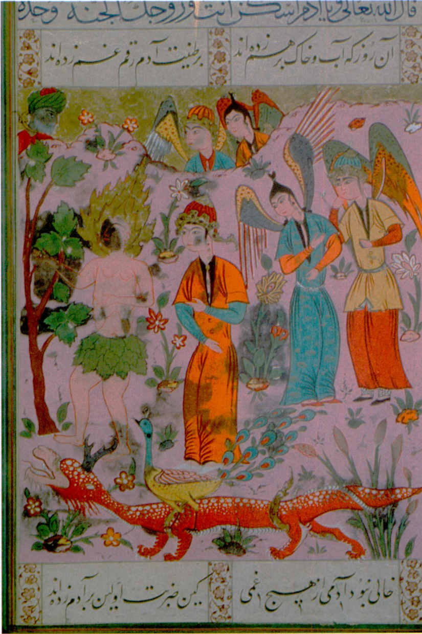
Resim 5- Hz. Âdem ve Havva'nın cennette yaratılması. Falnâme , Topkapı Sarayı Müzesi Kütüphanesi, H. 1702, vr. 51b.