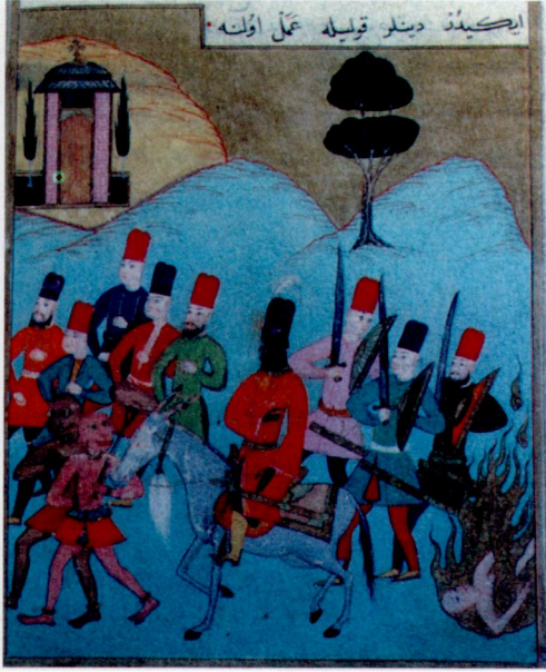
Resim 14- Deccal ve taraftarları. Bistâmi, Tercüme-i Miiftah-ı Cifr ei-Cami , İstanbul Üniversitesi Kütüphanesi, TY 6624, vr. 97b.