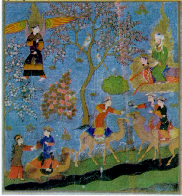
Resim 9- Cennette hurilerin develere binmesi. Mi'racnâme , Bibliotheque Nationale, Turc. 190, vr. 49b (Seguy, levha 42).