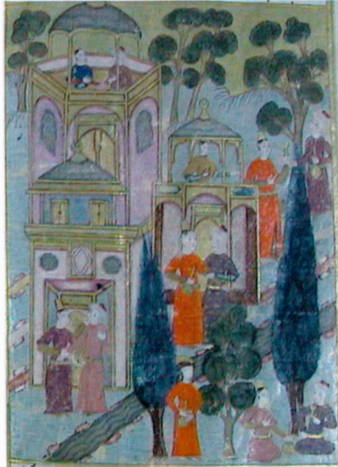
Resim 17- Cennet. Ahvâl-ı Kıyâmet , Süleymaniye Kütüphanesi, Hafid Efendi 139, vr. 50b.