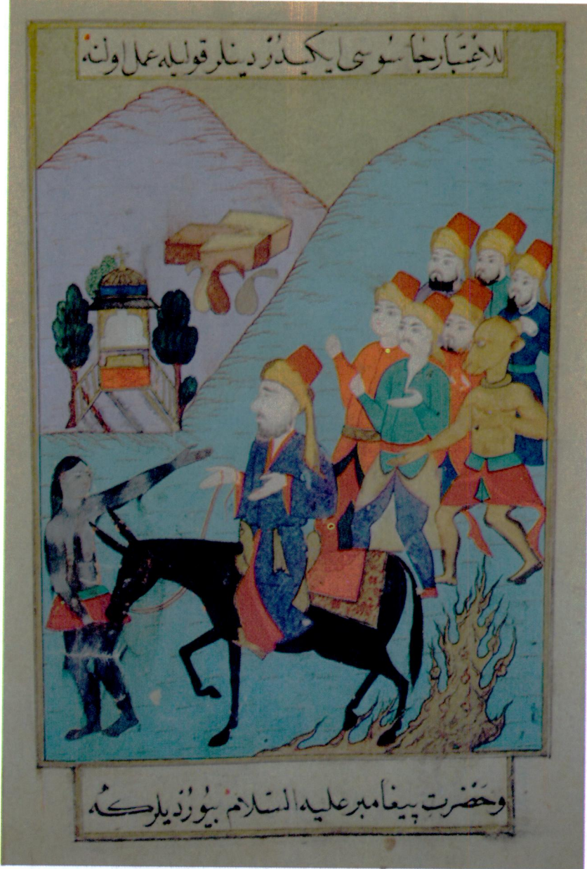
Resim 11- Deccal ve taraftarları. Bistâmi, Tercüme-i Miftah-ı Cifr el-Cami , Topkapı Sarayı Müzesi Kütüphanesi, B. 373, vr. 237b.