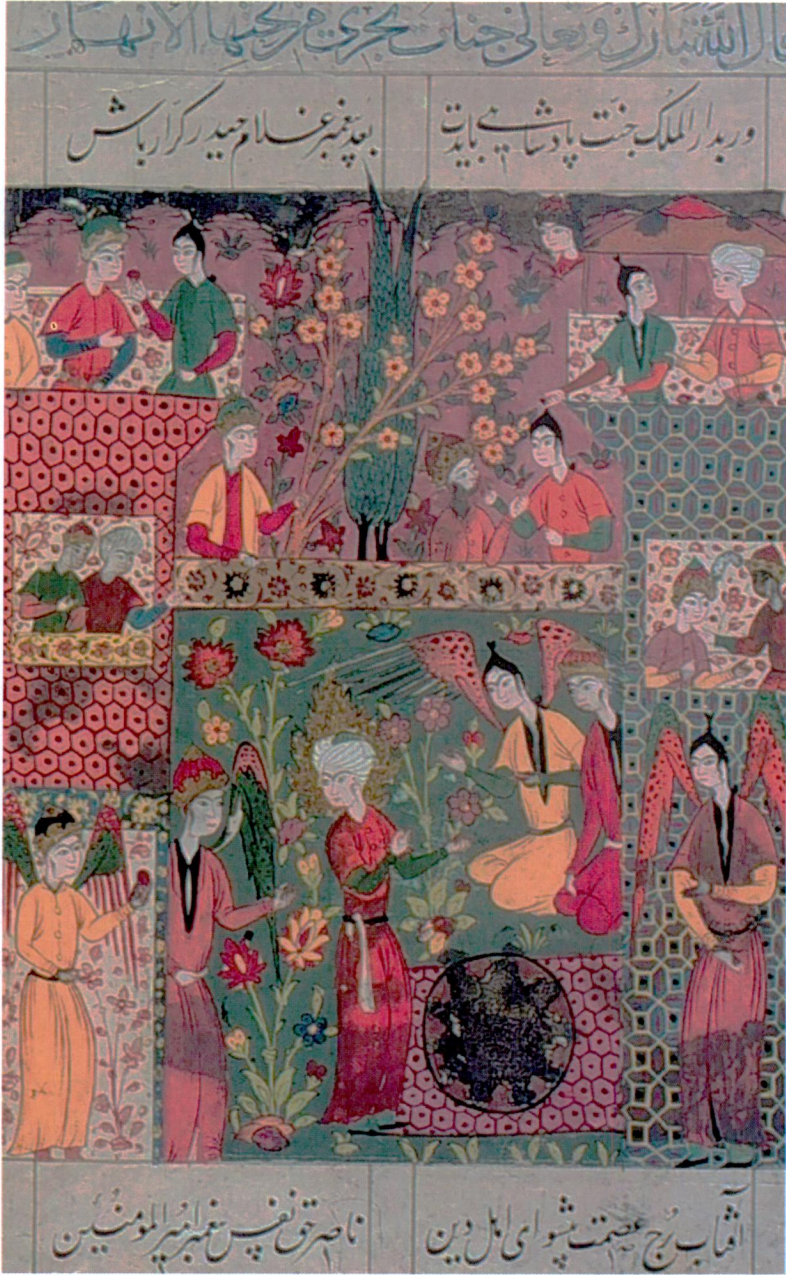
Resim 18- Cennet. Falnâme , Topkapı Sarayı Müzesi Kütüphanesi, H.1702, vr. 55b.