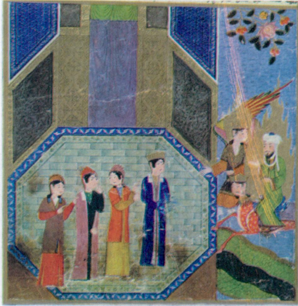
Resim 10- Mi'rac'da Hz. Muhammed'e Hz. Ömer'in cennetteki köşkünün gösterilmesi. Mi'racnâme , Bibliotheque Nationale, Turc. 190, vr. 51a. (Seguy, levha 43).