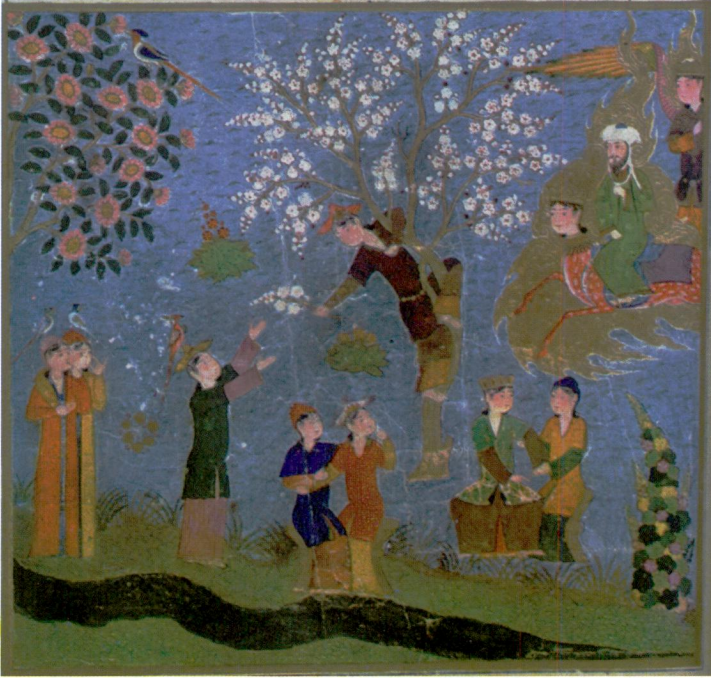
Resim 8- Cennette huriler. Mi'racnâme , Bibliotheque Nationale, Turc. 190, vr. 49a (Seguy, levha 41).