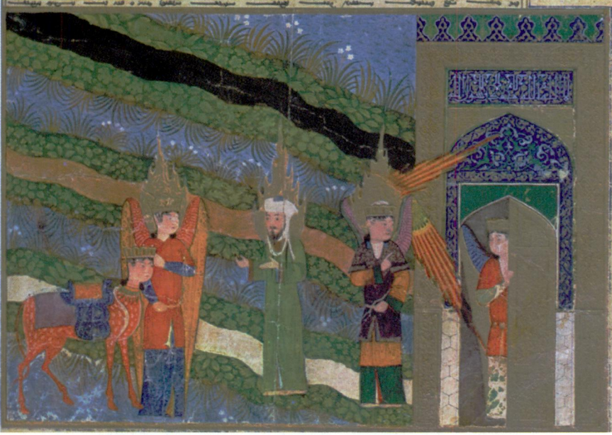
Resim 7- Hz. Muhammed'in Mi'rac'da cennete girişi. Mi'racnâme , Bibliotheque Nationale, Turc. 190, vr. 47b (Seguy, levha 40).