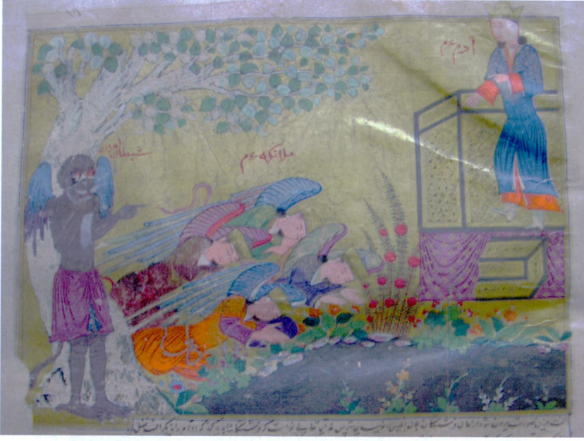
Resim 1 - Meleklerin Hz. Âdem'e secdesi. Külliyyât-ı Tarih , Topkapı Sarayı Müzesi Kütüphanesi, B. 282, vr. 16b.