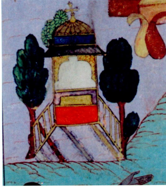
Resim 12- Deccal cenneti. Bistâmi, Tercüme-i Miftah-ı Cifr el-Cami , Topkapı Sarayı Müzesi Kütüphanesi, B. 373, vr. 237b. Detay.