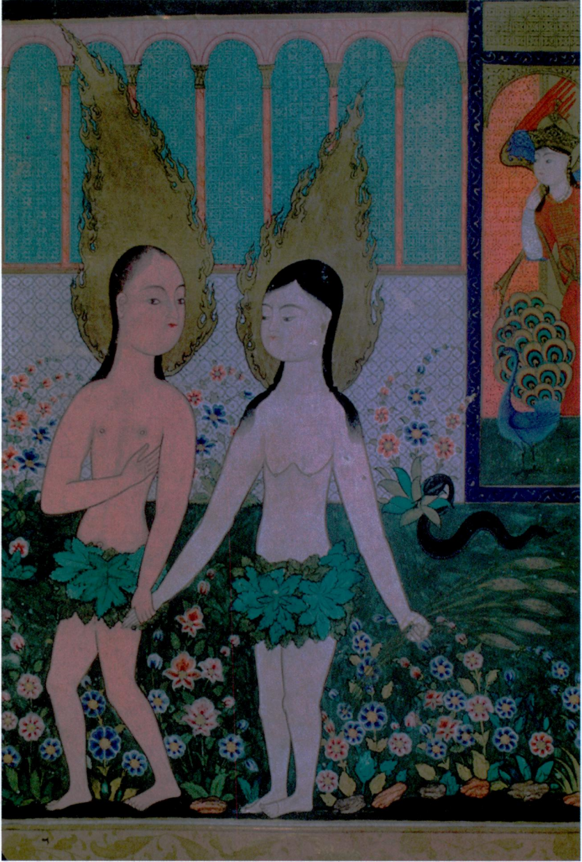
Resim 6- Hz. Âdem ve Havva. Falnâme , Topkapı Sarayı Müzesi Kütüphanesi, H. 1703, vr. 7b.