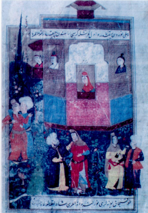
Resim 15- Cennet. Ahvâl-ı Kıyâmet, Philadelphia-Free Library Rare Book L Ms O, T7.