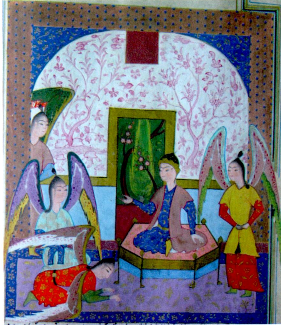
Resim 4- Meleklerin Hz. Âdem'e secdesi. Kıyas-ı Enbiyâ , Topkapı Sarayı Müzesi Kütüphanesi, H. 1226, vr. 8b.