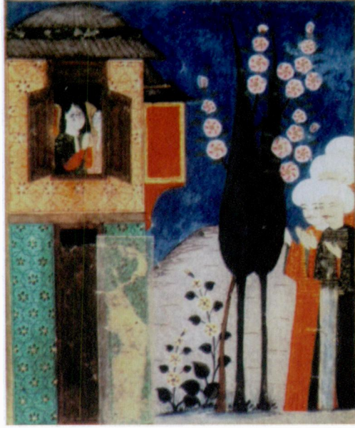
Resim 16- Cennet. Ahvâl-ı Kıyâmet , Berlin-Staatsbibliothek Ms. Or. Oct. 1596, vr. 49a.