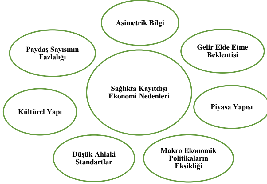
Şekil 2. Sağlıkta Kayıt Dışı Ekonomiye Neden Olan Faktörler