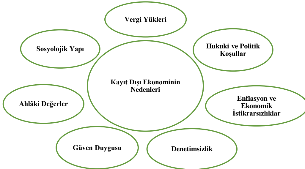
Şekil 1. Kayıt Dışı Ekonominin Nedenleri

Ekonomik verilerin saf ve tamamen objektif olarak elde edilmesinin güçlüğü tartışmaya açık bir durumdur, fakat elde edilemeyen ekonomik veriler ve bunların hesaplanamayışı ülkeler, toplumlar ve bireyler için üzerinde çalışmalar yapılması ve elde edilebilir hale getirilmesi gereken özel ve öncelikli bir alandır. Kayıt dışı ekonomik faaliyetlerin neden ortaya çıktığı, kayıt dışı ekonomiye sebep olan faktörler, kayıt dışı ekonominin anlaşılması ve kayıtlı hale getirebilecek çözüm yollarının ortaya konulabilmesi adına önemlidir. Nedenleri bilinen faaliyetlere yönelik önlemler alınabilecek, ortaya çıkışı ve büyümesi azaltılabilecek, gerekli ekonomik, politik ve hukuki yaptırımlar sağlanabilecektir. Bu önemlilik nedeniyle kayıt dışı ekonominin nedenleri üzerine yapılan Türkçe ve İngilizce literatür incelemelerinde kayıt dışı ekonomiyi oluşturan nedenlerin çalışmalarda farklı sınıflandırmalara tabi tutulduğu, çalışmaların içeriğine göre farklı başlıklarla incelendiği görülmüştür. Bu nedenle literatür taramaları sonucunda elde edilen temel nedenler araştırmacı tarafından belirli başlıklar oluşturularak Şekil 1’deki gibi incelenmeye çalışılmıştır.