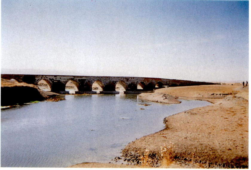
Ek XXI - Karas Kprs (Erzurum).