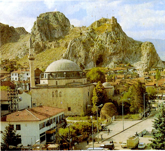
Ek XVI - Tokat Ali Paşa Camii.