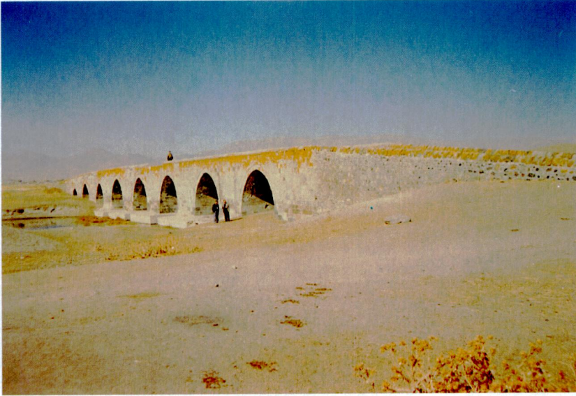
Ek XX - Karas Köprüsü (Erzurum).