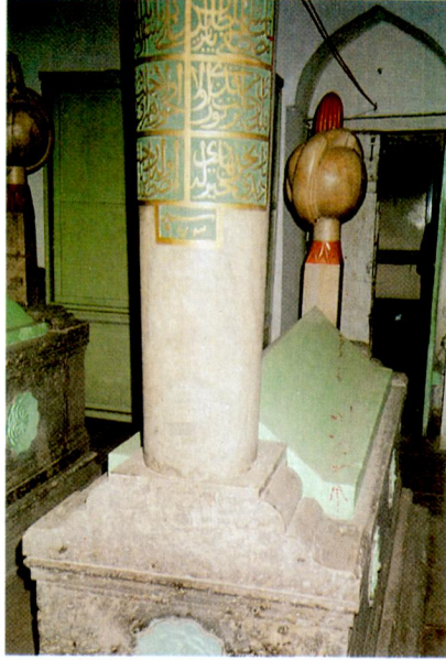
Ek XIII - Temerrüd Ali Paşa'nın oğlu Mustafa Bey'in mezarı.