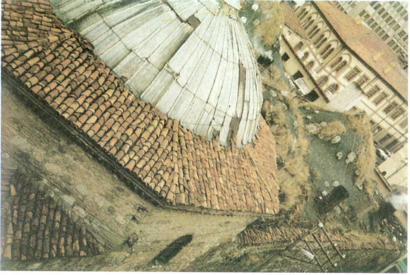
Ek XVII - Çorum Ali Paşa Hamamı (Yeni Hamam).