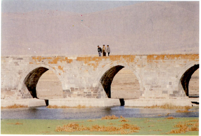
Ek XXII - Karas Kprs (Erzurum).