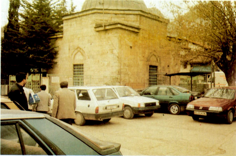
Ek XIV - Tokat'ta Temerrüd Ali Paşa ve ailesinin türbesi.