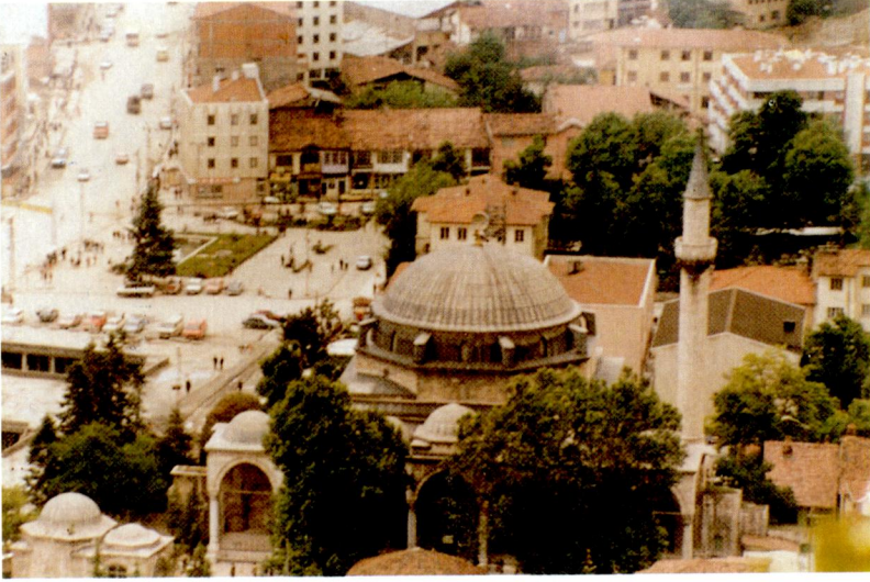
Ek XV - Tokat Ali Paşa Camii.