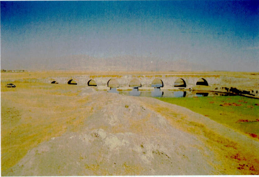
Ek XIX - Erzurum'da Temerrüd Ali Paşa tarafından yaptırılan köprü (Karas Köprüsü/Kınalı Köprü).