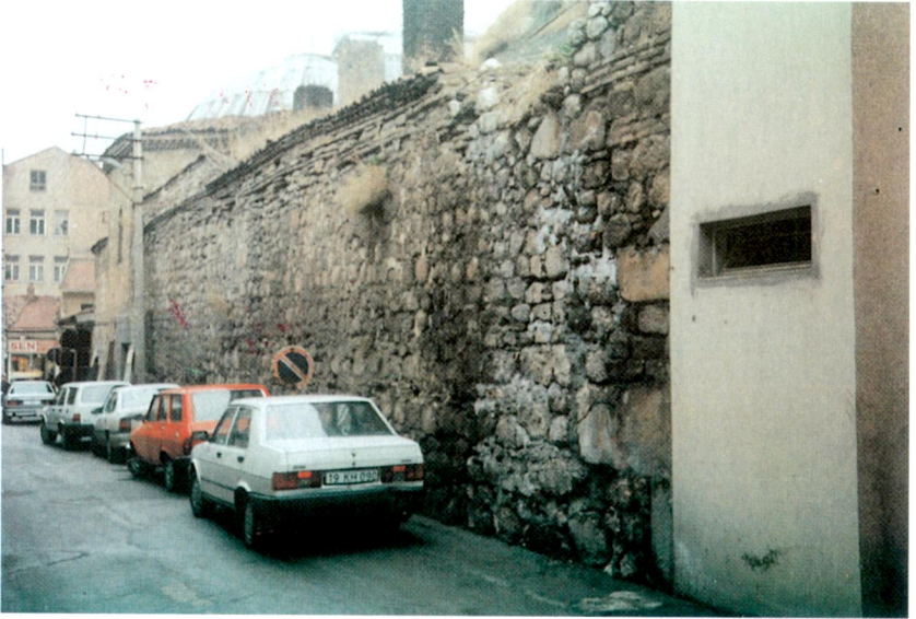
Ek XVIII - Çorum Ali Paşa Hamamı (Yeni Hamam)