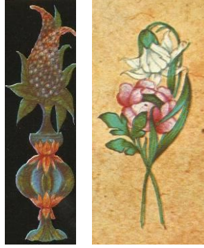
Şekil 2. Batı Etkili Çiçek Motifleri