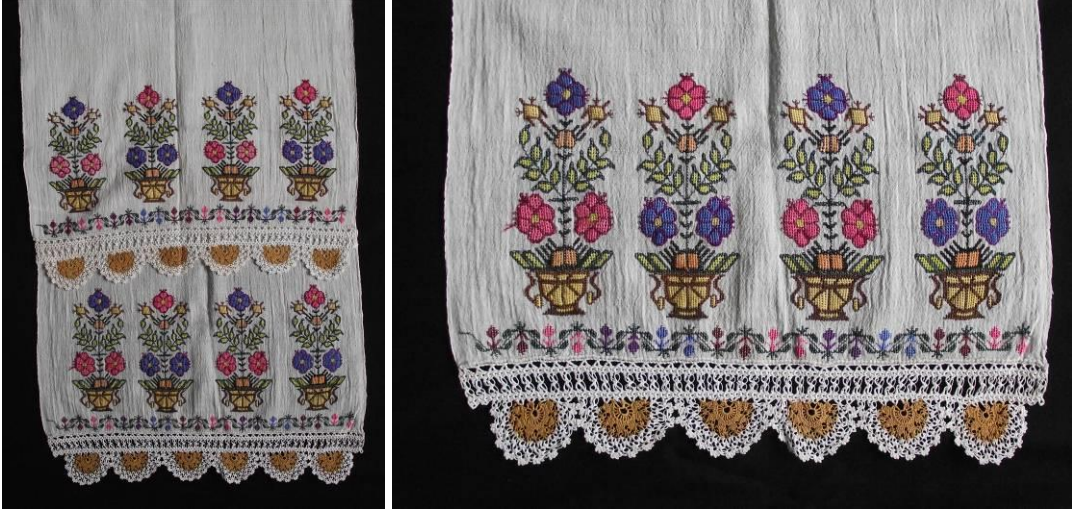
Obje Sıra No: 2

Desenlerdeki renklerde kimyasal boya kullanılmıştır. Peşkirin iki ucunda atkı ipliklerinin çekilmesi ve ardından bükülmesiyle elde edilmiş saçaklar bulunur.