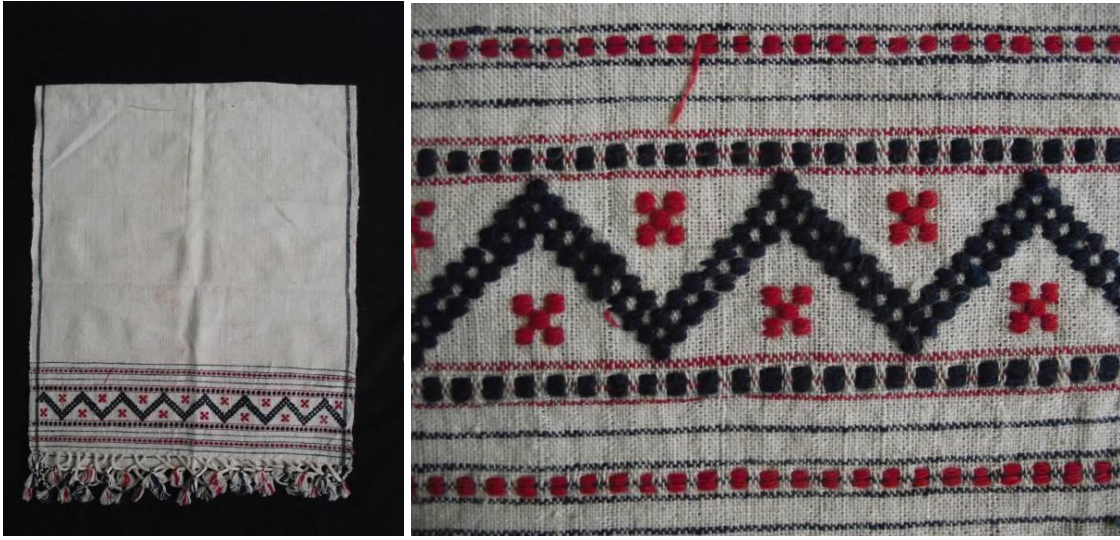
Obje Sıra No: 1