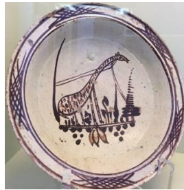
Şekil 3. Antik Çanakkale Hayvan Figürlü Seramik Tabak

Obje 4; 16.03.2013 tarihinde yapılan alan araştırmasında Almanya doğumlu Yasemin Erman'a ait olup, Yeşilyurt köyünde tespit edilmiş bir peşkir. Havlu amaçlı kullanılmıştır. Araştırma esnasında 35 yıllık bir ürün olduğu tespit edilmiştir. Yöresel olarak geyikli adıyla bilinir. El tezgâhlarında dokunan mekikli bir dokuma olup, üzerinde ayrıca hesap işi süsleme tekniğinde yapılmış işlemler vardır. Peşkir; dar enli dokuma türünde, çözümlü ve atkı iplik sıraları pamuk ipliklerden oluşmaktadır. Bu iplikler doğal renklere sahiptir. Desenlerdeki renkli ipliklerde kimyasal boya kullanılmıştır. Peşkirin üzerinde buğday başağına benzer motif ile yöredeki ismiyle geyik motifi ve kıvrımlı su motif sırası bulunmaktadır. Antik Çanakkale seramik tabağında bulunan zürafa motifli örnek (Şekil 3) ile geyikli adı ile yörede kullanılan peşkir arasında kompozisyon olarak bir benzerlik bulunmaktadır.