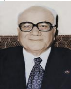
Fiziyojoloji doçenti Dr. Sadi Irmak