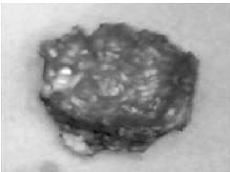
Resim 3. Kitlenin makroskopik görünümü

tuğuna inanılır. Bu teori normal menstrüel siklus sırasında endometrial dokunun transplantasyonu ile abdominal duvarda subkutanöz endometriozis oluşumu ile doğrulanmaktadır (17). İnsizyon skarında endometriozis gelişme sıklığı histerotominin hangi endikasyonla yapıldığına bağlıdır. Örneğin 2. trimester abortuslarında yapılan histerotomi sonrasında skar endometriozisi gelişme sıklığı %5.08 sezaryen sonrası %0,03-%0,4 arasında değişmektedir (20).