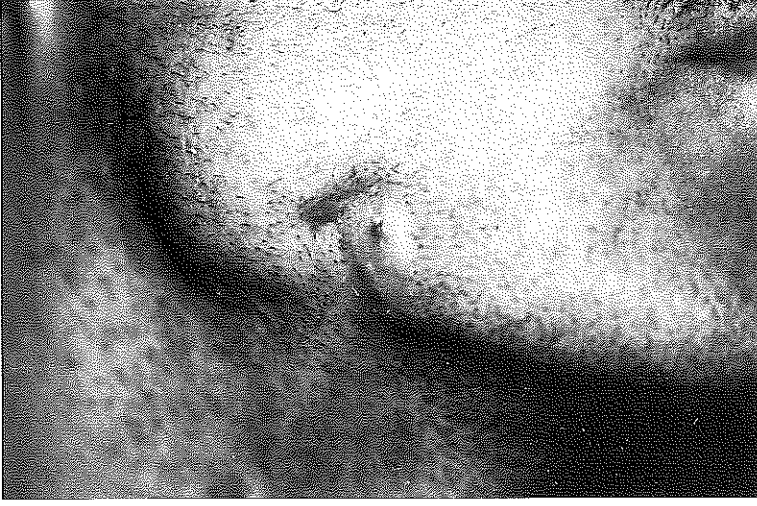
Resim 3a, b, c. Pürülan akıntının görüldüğü osteomyelit fistülleri