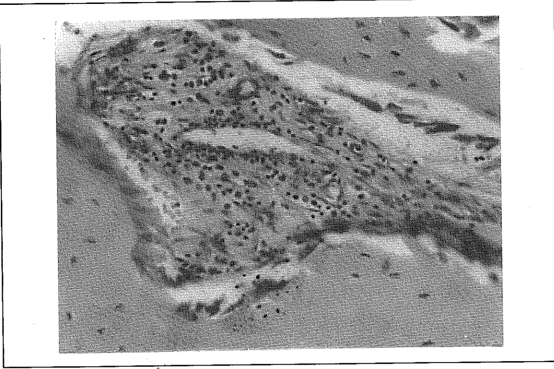
Resim 1. Trabeküler yapıda kemik dokusu arasında lenfosit ve plazma hücresi infiltrasyonu içeren damardan zengin bağ dokusu (H&E x 400)

Hastaların tamamında ortopantomografik tetkik yapılmış ve kemiğin lezyon bölgesinde lokal radyoluslan ve osteolizis gösteren alanlar saptanmış, iki olguda mandibulanın kortikal yapısında düzensiz kalınlaşmalar tespit edilmiştir (Resim 4).