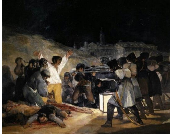
Resim 13: Francisco de Goya, “3 Mayıs 1808” Tuvall üzerine yağlıboya, 268 x 347 cm, Madrid