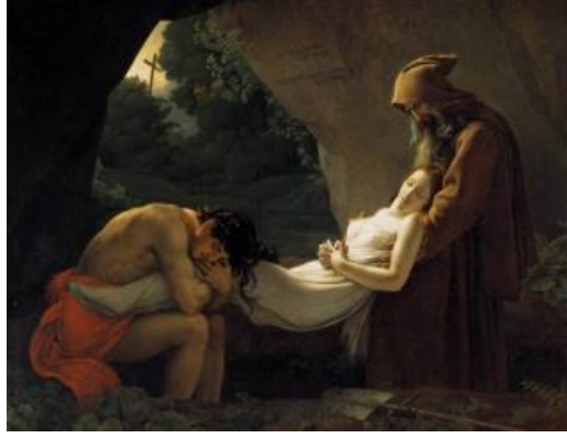
Resim .9: Anne-Louis Girodet “ Burial of Atala” Tuval üzerine yağlıboya,2,07x2,67 cm,