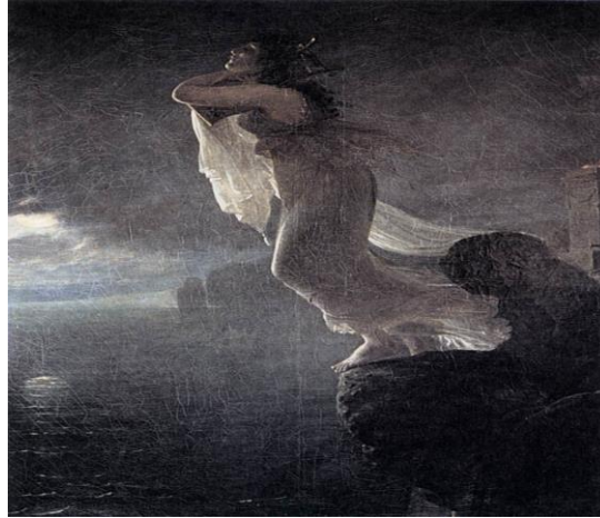
Resim 10: Antoine-Jean Gros “ Sappho at Leucate”, Tuval üzerine yağlıboya,122x100cm

Gros, Fransız neoklasik akımının öncü isimlerinden olan David'in öğrenciliğini yapmış, Arcola Savaşına tanıklık ederek ve savaş sahnelerinden esinlenerek, Fransız komutan, Napolyon Bonaparte'nin portresini resmetmiştir. Ressam, aynı zamanda Napolyon ordusuyla savaflara iştirak ederek çok sayıda savaş resimlerini yapmış ve söz konusu resimlerinde romantik eğilimler içeren güçlü figürler çizmiştir. Gross, aşağıdaki resminde de görüleceği üzere realist akımın tersine romantik tematiğini tuvallerine yansıtmaya çalışmıştır. Söz konusu resim 10'da Gros, romantik resmin en güzel ve ilk örneklerinden birini verir. Resimde Sappho karakterindeki kadın figürünün, üzerindeki şeffaf elbisesiyle arkasında kurban bir sunak bırakarak parıldayan ay ışına uzanmak istercesine iki dünya arasındaki gelgiti yansıtmaya çalıştığı söylenebilir.