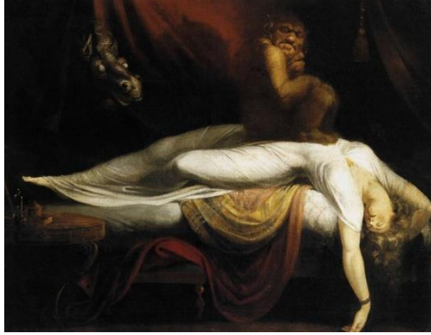
Resim 11: Henry Fuseli, “Karabasan”, Tuvall üzerine yağlıboya,101.5x127 cm, ABD.

resimlerinde insan doğasının en bilinmez yanlarını da resmetmiştir.( sanat atlası,2010,313) Fuseli'nin resimlerinin büyük çoğunluğunda bastırılmış şiddet, korku ve cinsel sapkınlıklar yansımaktadır. Yukarıda adı geçen ve Fusel'nin en önemli başyapıtı olarak bilinen “Kabus” (Resim 11) resmi erotizm ve korkuyu bir arada barındırdığı söylenebilir. Resimde uyuyan kadının karın bölgesinin üzerine oturan yaratık biçimindeki figür, kadının kâbus görmesine sebep olduğu söylenebilir. Resmin sol üst köşesinde, perdenin arkasından bakan ve at başını andıran hayalimsi figürün, kötü bir cini temsil ettiğinden söz edilebilir.