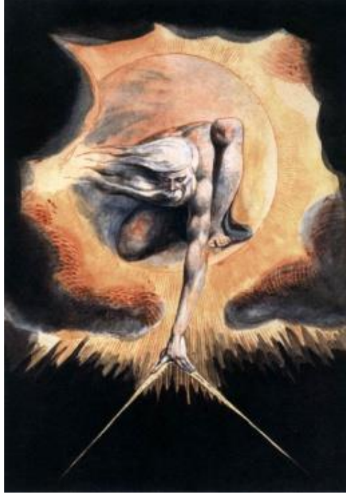
Resim 12 : William Blake, “Günlerin Başlangıcı”, Kağıt üzerine guaj ve suluboya, 23, 3x16,8 cm