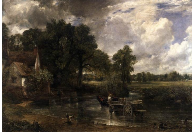
Resim 14 : John Constable “The Hay-Wain” Tuval üzerine yağlıboya 130x185cm

dönüştürmüştür. Constable dünyevi olasılıklara değil, sanatın mutlak dünyasına ait bir ressamdır. Onun için de has bir ressamdır.” (Venturi , 2018,140-141)