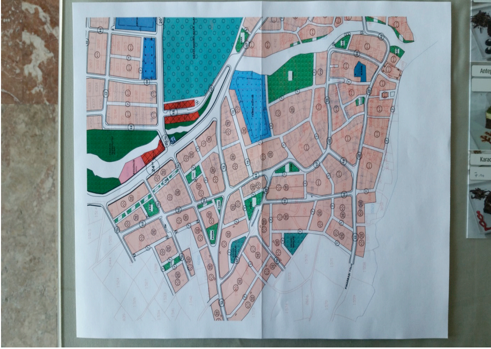
Ek 10: Honaz Belediyesi (Hisar Mahallesi) 2015