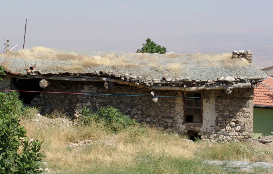
Ek 2: Mübadil Abidin oğlu Sabri Davran'ın iskan olduğu toprak damlı ev (arka taraf)