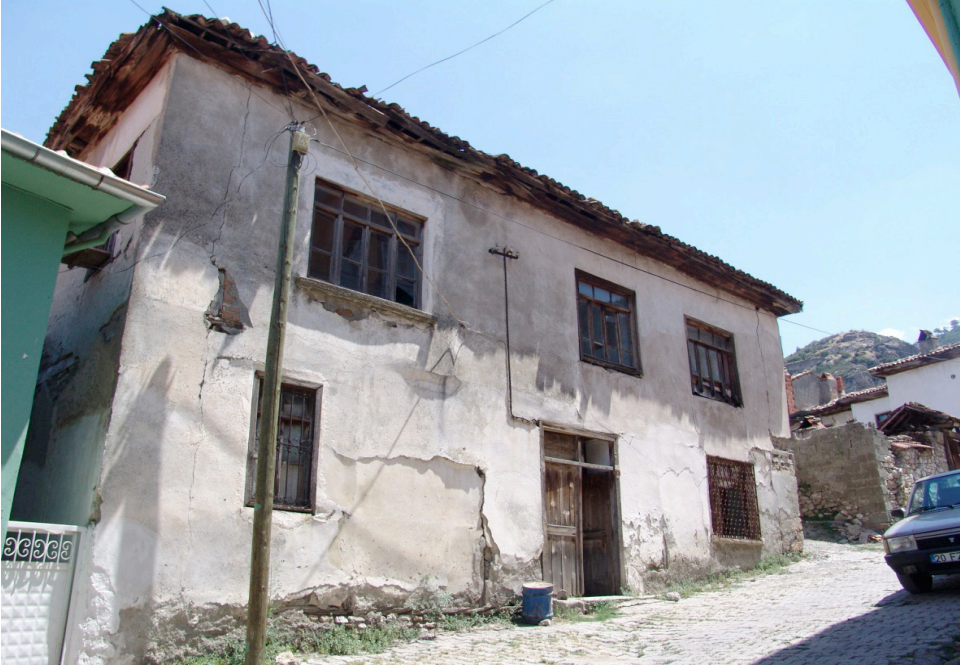
Ek 3: Mübadil Muhittin Yavuz'un iskan olduğu kiremit çatılı ev (ön taraf) (ev yıkılmıştır)