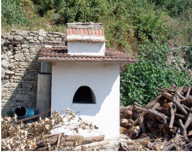
Göçmen Fırını (sonradan örnek yapılmış - 2006) (Değirmen-Honaz)