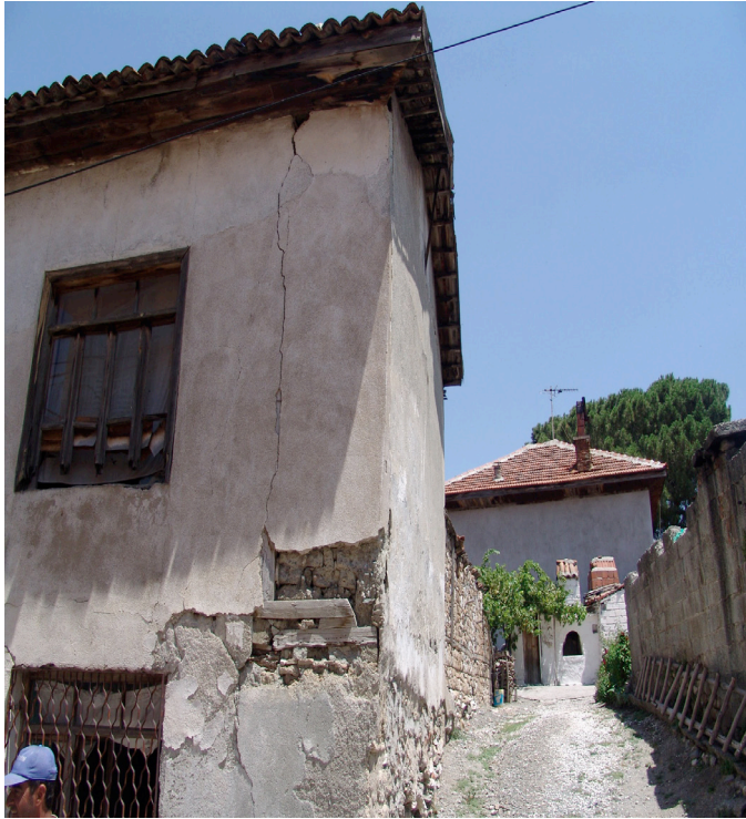
Ek 8: Göçmen Fırını (Orijinal)