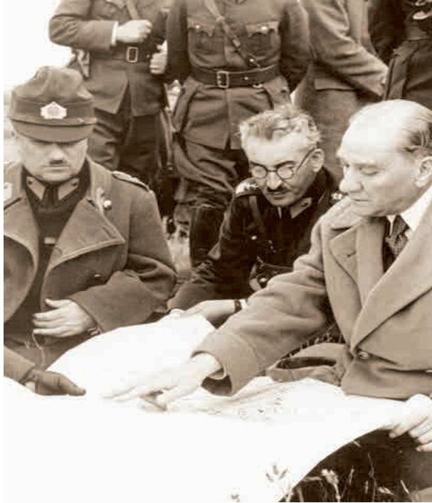
Ek 1: Ali Fuad Erden (Sol başta), Trakya Manevralarında Mustafa Kemal Atatürk ile (1936).