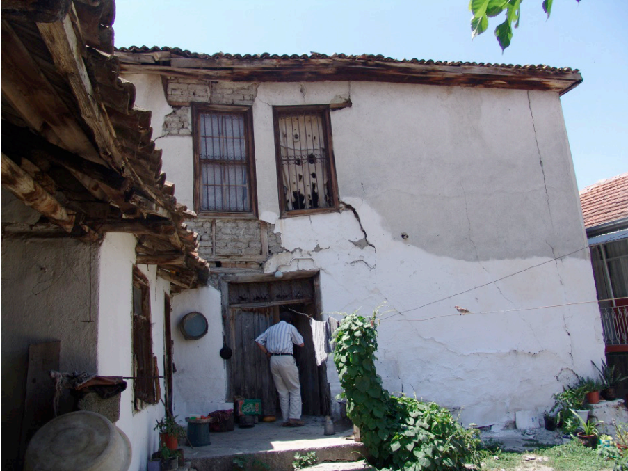
Ek 4: Mübadil Muhittin Yavuz'un iskan olduğu kiremit çatılı ev (arka taraf)