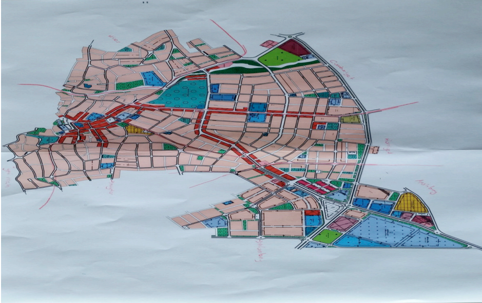
Ek 9: Honaz Belediyesi (Mahalleler)