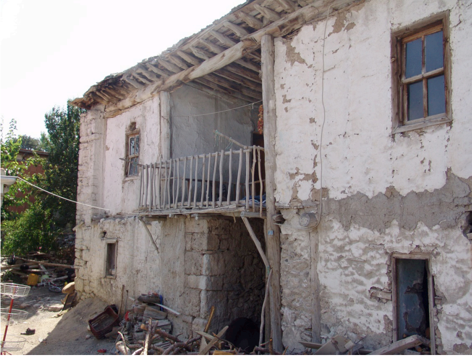
EK 1: Mübadil Abidin oğlu Sabri Davran'ın iskan olduğu toprak damlı ev (ön taraf) (ev yıkılmıştır)