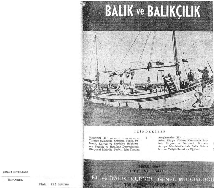
Şekil.4: Balık ve Balıkçılık Bülteni

- “Balık ve Balıkçılık” isimli süreli yayın Et ve Balık Kurumu tarafından basılmış ve sözkonusu yıllarda, farklı nitelikteki su ürünlerinin üretim ve ticareti konularında bilgiler içermektedir (Şekil.4).