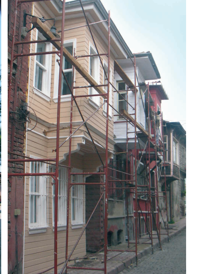
Şehsuvarbey Sokağı'nda devam eden bakım-onarım çalışmaları