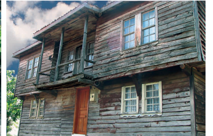
Akçakese köyünden korunması gerekli kültür varlığı örnekleri

600'dür. Köyün sınırları içinde ilköğretim, karakol, mezarlık, muhtarlık binası, cami ve telefon santrali gibi donatı alanları bulunmaktadır.