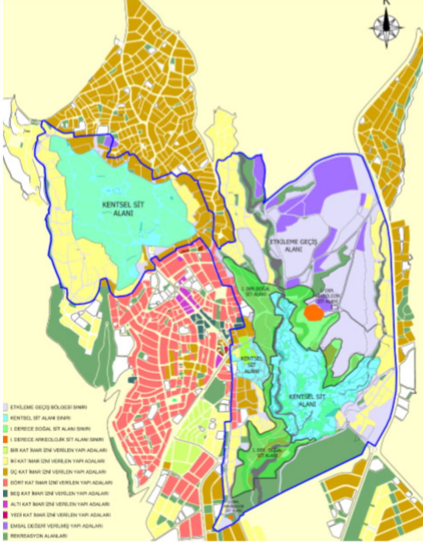
Şekil 1. 2010 yılı Koruma Amaçlı İlave + Revizyon Uygulama İmar Planı İmar Planı 5

muştur. Bununla birlikte kentin UNESCO Dünya Kültür Mirası Listesi'ne dahil edilmesinden sonra inşa edilen yapılarda geleneksel mimariye öykünme yoğunlaşmıştır.