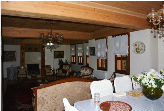
Fotoğraf 13. Derya Sarialtın Coşkun Konağı İç Mekân Detayı

İç mekânda da geleneksel unsurların mimaride uygulandığını görmekteyiz. Bu uygulamalar özellikle ahşap tavan örtüsünde görünür olmuştur. Zemin döşemesinde uygulanan parkeye de ahşap görünüm verilerek geleneksel etkiyi koruma amacı güdülmüştür. Salondaki şömine, modern ve geleneksel unsurları bir araya getiren bir yorumla ele alınmıştır. Dış cephede geleneğe bağlı kalmada önemli bir işlev gören pencere düzenlemeleri iç mekânda da geleneksel etkiyi sürdürmektedir. Ancak yapının açık mutfak-salon uygulaması modern bir tasarım ve düzenleme içindedir.