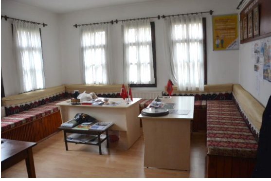
Fotoğraf 24. Türkiye Emekliler (İşçi) Derneği Safranbolu Şubesi İç Mekân Detayı

Derneğin iç mekânında da geleneksel mimariye öykünme vardır. Tavan ve yer döşemelerinde ahşap malzeme yerine modern konutlarda sıklıkla karşılaştığımız düzenlemeler görülse de odaların duvarları boyunca pencere hizasına kadar yükselen sedirler iç mekândaki geleneksel dokuya öykünmeye belirgin örneklerdir.