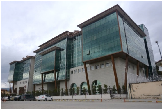
Fotoğraf 21. Fethi Toker Güzel Sanatlar ve Tasarım Fakültesi

Karabük Üniversitesi Safranbolu yerleşkesindeki mimari tasarımını Aysun Özköse'nin 33 yaptığı Fethi Toker Güzel Sanatlar ve Tasarım Fakültesi, geleneksel Safranbolu evlerine öykünme içeren diğer bir yapıdır. Yapıda geleneksel mimariye öykünülerek, zemin kat üzerine yükselen bölümler çıkma oda şeklinde tasarlanmıştır. Bunun yanı sıra çıkmaları destekleyen modern payandalar ahşap görünümlü olup geleneksel ahşap konsollara atıf içermektedir. Yapının çatı konstrüksiyonu, geniş saçakları ve iç mekânındaki bazı -geleneksel büyük çaplı konaklardaki havuzlara öykünülen- havuz görünümlü bölümler geleneksel dokuya atıf içerir. Bunun dışında iç mekâna yansıyan geleneksel etki yoktur.