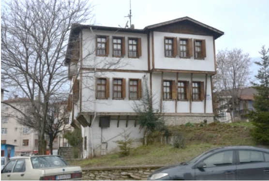
Fotoğraf 23. Türkiye Emekliler (İşçi) Derneği Safranbolu Şubesi