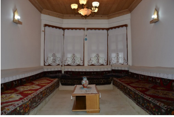
Fotoğraf 14. Derya Sarialtın Coşkun Konağı İç Mekân Detayı

lar boyunca uzanan seki biçiminde düzenlenen sedirler ve geleneksel örtüler ile artırılan etki, geleneksel Safranbolu evlerinin iç mekân düzenlemesinin etkisini özellikle ikinci kata güçlü bir şekilde taşımaktadır.