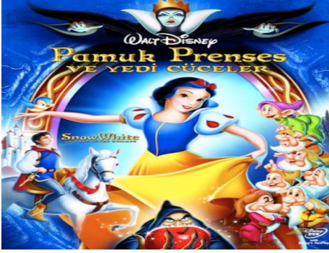
Resim 2.