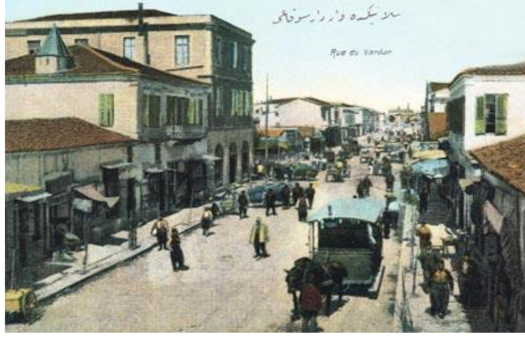
Selanik'te Vardar Sokağı/Atlı Tramvaylar (Ünlü, 2006: 52)

Tramvay, Selanik'e girişinden itibaren çok rağbet gören bir ulaşım aracı olmuştur. Bu durum yolcu sayısının her geçen gün artmasından anlaşılmaktaydı. Bunun temel sebebi belediyenin şehir nüfusunun tüm tabakalarının tramvay kullanımını kolaylaştırma çabaları olmuştur. Bu noktada tarifeler konusunda şirketin aldığı kararlarda belediyenin belirli etkisi vardı. Belediyenin bu girişimleri ile fiyatlar kişinin bağlı olduğu toplumsal guruba göre değişebilmekteydi (Anastassiadou, 2010: 160).