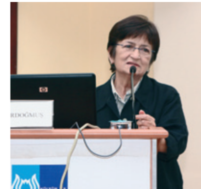
Kimyacı Emine Erdoğan