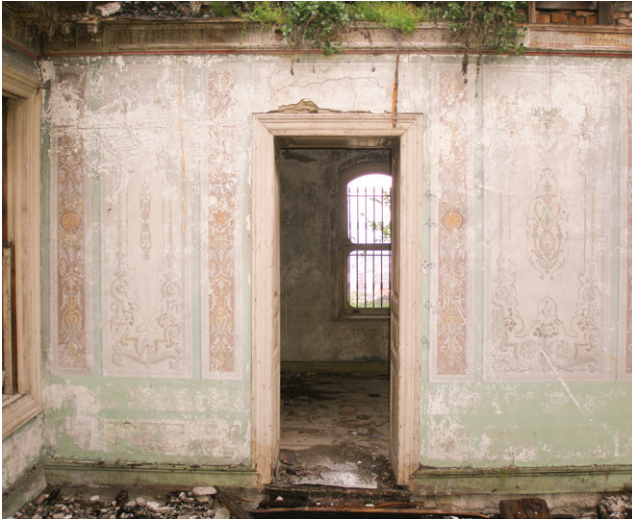
Konağın iç mekânından görünüm, restorasyondan önce

Çatı katı, ahşap karkas üzerine yalıtımlı baskısı, iç mekân ise, bağdadi sıvadır. Oda duvarlarında sıva üzerine ince kalem işleri vardır. Oda ve sofa duvarları yoğun bir biçimde bitkisel ve geometrik bezemelerle süslenmiştir. Konakta ve konağın müstemilatında, Fransa'dan özel olarak getirilen bazı malzemeler kullanılmıştır.