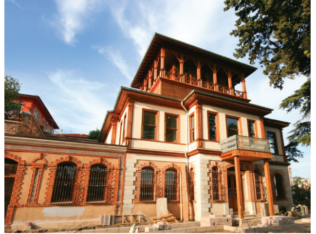
Sırrı Paşa Konağı, restorasyondan sonra