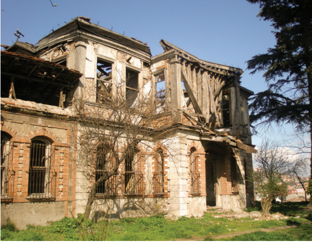
Sırrı Paşa Konağı, restorasyondan önce