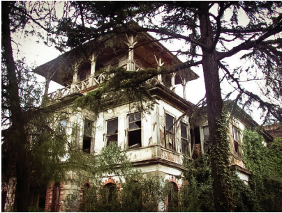
İzmit Selim Sırrı Paşa Konağı, restorasyondan önce