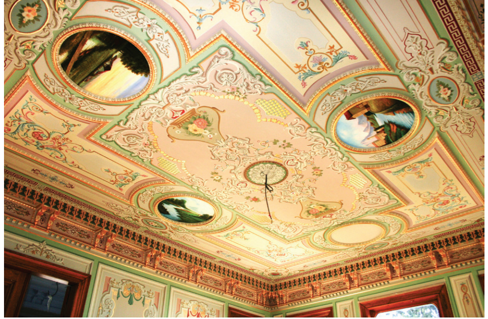
Sırrı Paşa konağı kalem işleri ve bezemeler