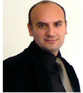
Őenol KARADENİZ Ministry of Culture and Tourism