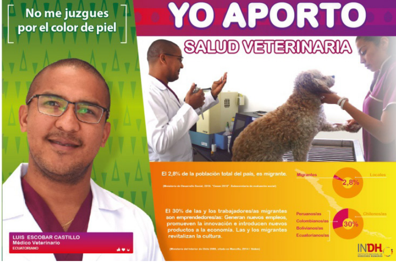
Resim 4. “Veterinerlik” Başlıklı Kamu Spotu Reklamı