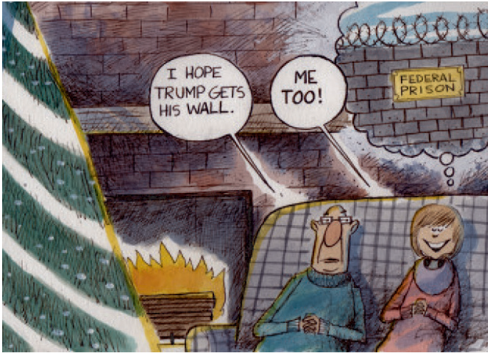
Resim 5. “Hapishane” Konulu Propaganda Karikatürü

“Hapishane” konulu propaganda karikatürü, Creators Syndicate'den Chris Britt'e aittir. Gösteren açıdan karikatür ele alındığında, yılbaşını kutlayan bir evli çiftin yansıtıldığı görülmektedir. Görsel kodlarda evli çift, büyük bir yılbaşı ağacının başında, şöminenin hemen yanında oturmakta ve hayal kurmaktadır. Kurdukları hayalde üstünde “Federal hapishane” yazılı kodu bulunan dikenli tellerin olduğu bir duvar yansıtılmaktadır. Adam eşine “Umarım Trump duvarına kavuşur” şeklinde bir söylemde bulunmakta, eşi ise “Bence de!” şeklinde karşılık vermektedir. Sunum kodları içerisinde kadının mutlu olduğu aktarılmaktadır.