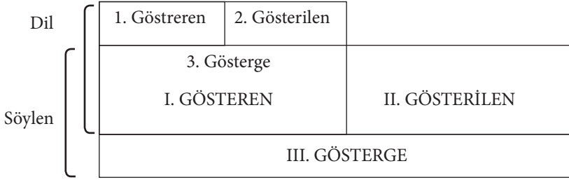
Şekil 1: Ferdinand De Saussure’ün Göstergeler Modeli

olmasının gerekmediğini söylemektedir. Bir gösterge, bir kavramın yerine geçebilmesi için toplumsal bir uzlaşının olması gerektiğini savunmaktadır (Güngör, 2013, s. 214). Toplumsal uzlaşıda da herkesin göstergenin ifade ettiği kavram ile doğrudan bir bağ kurması gerekmektedir.