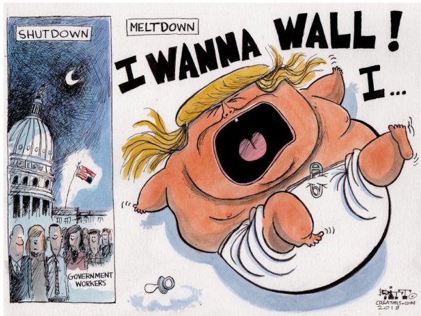
Resim 2. “Bebek” Konulu Propaganda Karikatürü

“Bebek” konulu propaganda karikatürü, Creators Syndicate'den Chris Britt'e aittir. Gösteren boyutunda incelendiğinde, karikatürün iki bölümden oluştuğu görülmektedir. Birinci bölümde, “hükümet çalışanları” şeklinde bir yazılı kod yer almaktadır. Bu bölümdeki görsel kodlarda ABD bayrağının ters çevrildiği, hükümet çalışanlarının geceleyin Beyaz Saray'ın önünde beklediği ve görselde yer alan kişilerin durgun bir halde oldukları yansıtılmaktadır. Diğer yandan Beyaz Saray sunum kodları içerisinde eğik olarak aktarılmaktadır. İkinci bölümde ise devasa boyutta Trump şeklinde bir bebek görseline yer verilmektedir. Karikatürde Trump'ın ağladığı aktarılmakta ve ağzından “Duvar istiyorum!” şeklinde yazılı koda yer verilmektedir. Sunum kodlarında Trump'ın ağzının sonuna kadar açık olduğu aktarılmaktadır. Birinci bölümde “Hükümeti kapatma”, ikinci bölümde ise “Tepesi atma” şeklinde iki farklı başlığa yer verilmektedir. Birinci bölümdeki görsel karikatürün yaklaşık olarak dörtte birini, ikinci bölümdeki görsel ise karikatürün yaklaşık olarak dörtte üçünü orantısız bir şekilde kaplamaktadır.