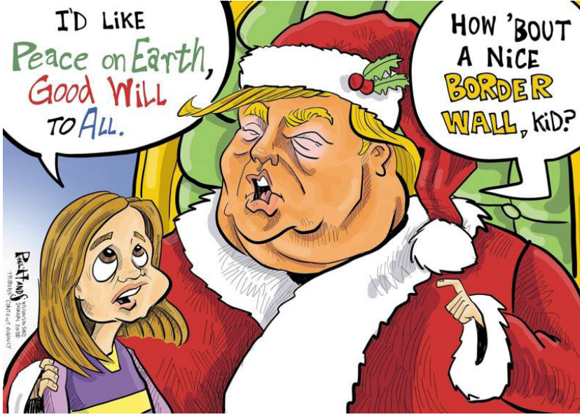
Resim 1. “Noel Baba” Konulu Propaganda Karikatürü