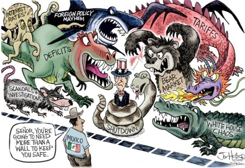
Resim 4. “Sam Amca” Konulu Propaganda Karikatürü