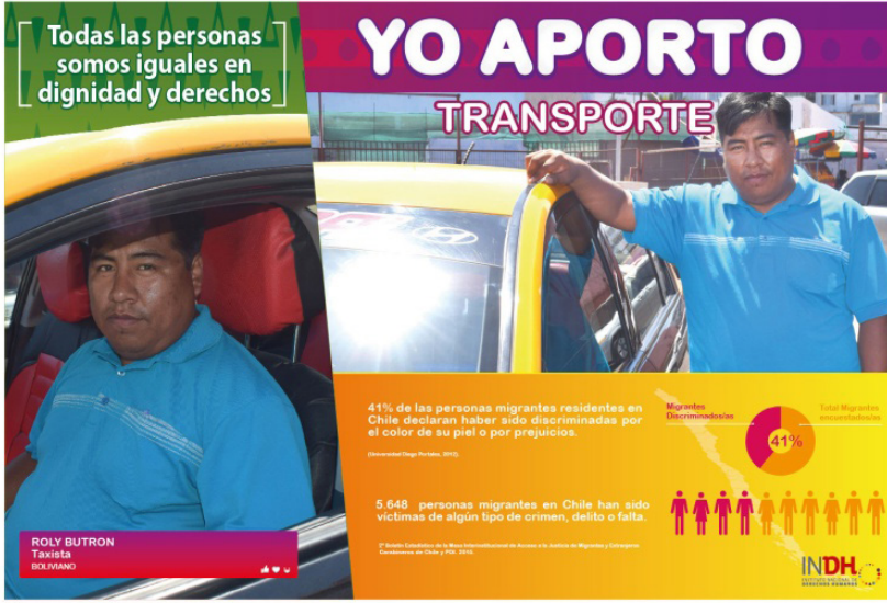
Resim 6. “Ulaşım” Başlıklı Kamu Spotu Reklamı