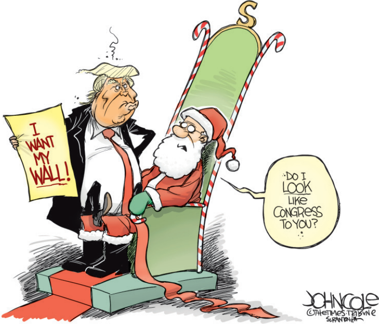
Resim 6. “Kongre” Konulu Propaganda Karikatürü