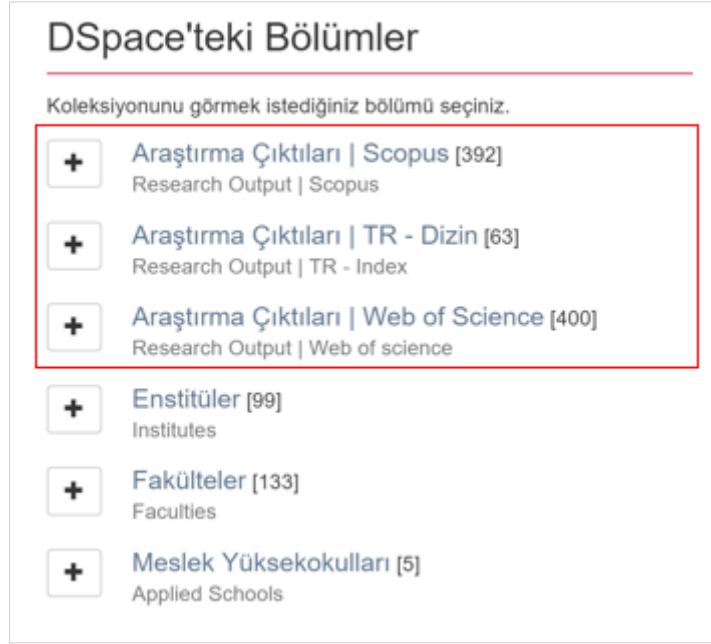
Şekil 7. İSTE kurumsal akademik arşiv araştırma çıktı görünümüleri 3

Kurumsal akademik arşivlerde, kayıtların detaylı ve standartlara uygun olması, araştırmacıların işini kolaylaştırması, harmanlama sistemlerinin içeriğinin belli bir düzende olması ve uluslararası görünürlüğü artırması bakımından Kurumsal Akademik Arşiv Sistemine Kayıt Giriş Rehberi'nin (Çelik, 2016) incelenmesinde yarar vardır. Bu rehber, Driver Rehberi 2.0 esas alınarak Dublin Core (DC) veri giriş alanlarına göre, DSpace kurumsal arşiv sistemi örneği üzerinden hazırlanmıştır. Rehberin amacı, Türkiye'deki kurumsal akademik arşivlere kayıt girişi yapanlara yardımcı olmak ve kayıtların standartlara uygun olarak oluşturulmasına katkı sağlamaktır (Çelik, 2016).