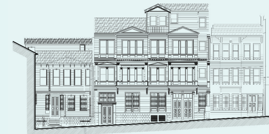
KAYSERİLİ AHMET PAŞA KONAĞI

KÜLTÜR VARLIKLARI DAİRE BAŞKANLIĞI • KORUMA UYGULAMA VE DENETİM MÜDÜRLÜĞÜ Molla Hüseyin Mahallesi Kayserili Ahmet Paşa Sokağı No:16 Fatih/İstanbul Pk: 34134 Tel: 212 455 37 00 Fax: 212 527 44 99 e-posta: kudeb@ibb.gov.tr