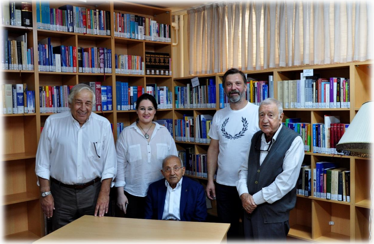
Vakfi ziyaret edenler toplantıda