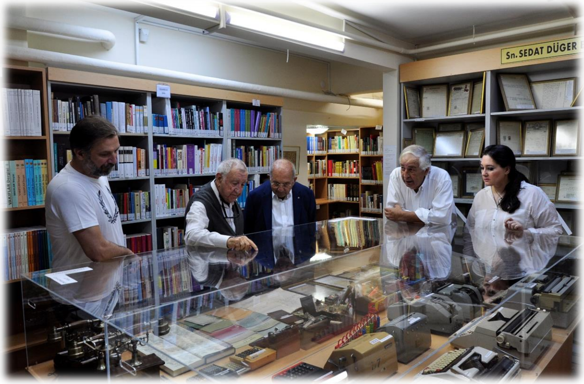
Vakfi ziyaret edenler müzede inceleme yapıyor