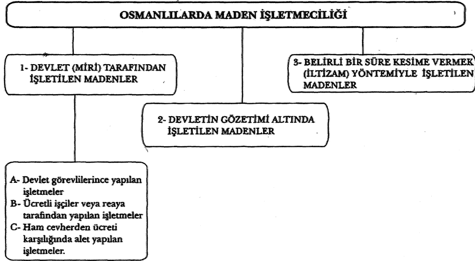
Şekil 1. Osmanlılarda Maden İşletmeciliği.

Özellikle askeri amaçlar için kullanılan madenlerin işletmelerinde devlet görevlileri istihdam edilmiştir. Demir cevheri, genellikle top yuvarlağı, gülle ve bumbara yapımında, bakır cevheri ise top dökmek, gemi yapımı gibi askeri amaçlı işlerde kullanılmıştır. Barut yapımında ise guhërçile ve kükürt gibi madenler değerlendirilmiştir. Adı geçen bu madenlerin işletmelerinde daha çok askeri kesim çalıştırılmıştır . Savaşların olmadığı banş dönemlerinde dahi demir, bakır, guherçile ve kükürt işletmelerinde çalışan