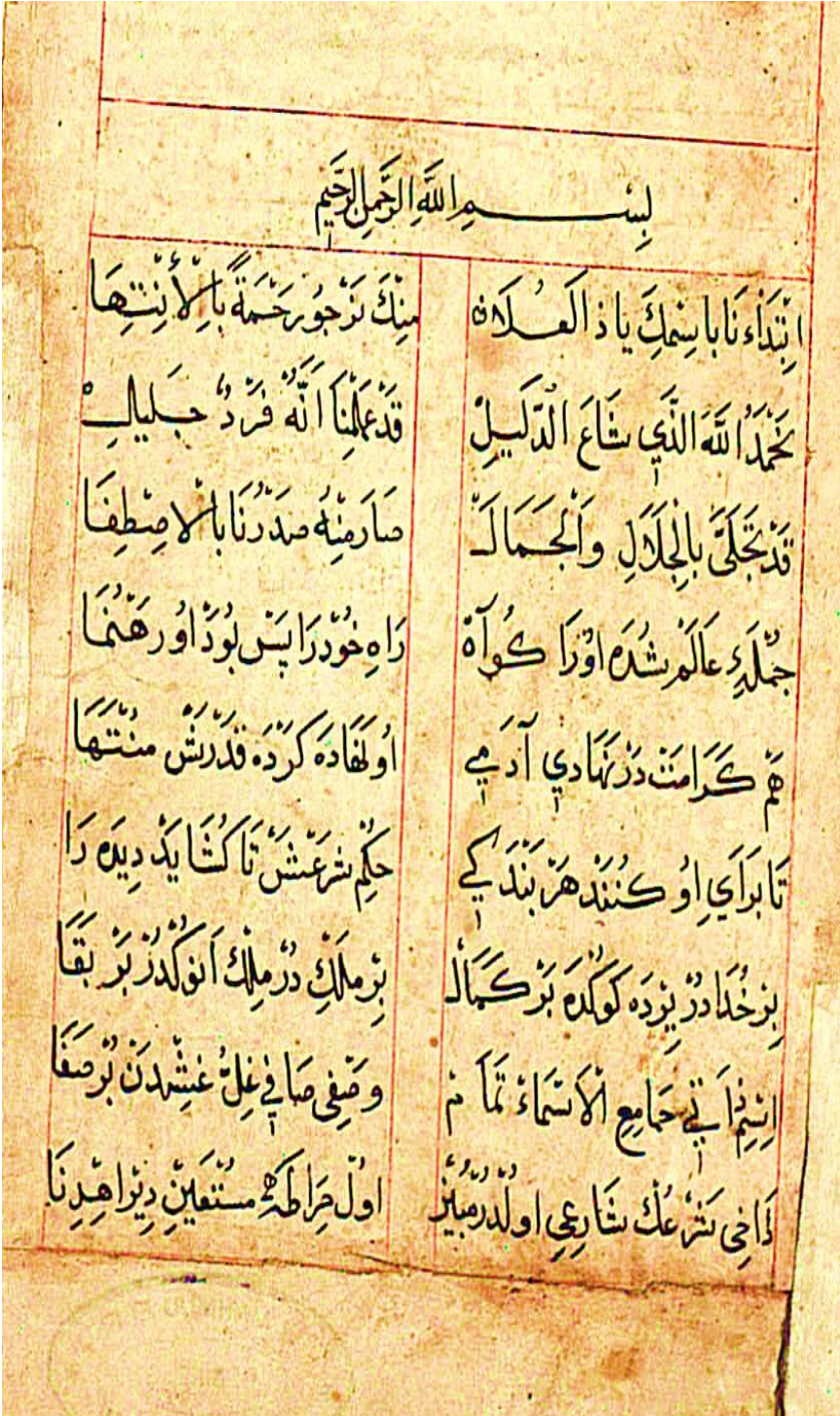
Resim 3: Hacı Mahmud Nüshası 1b sayfası.