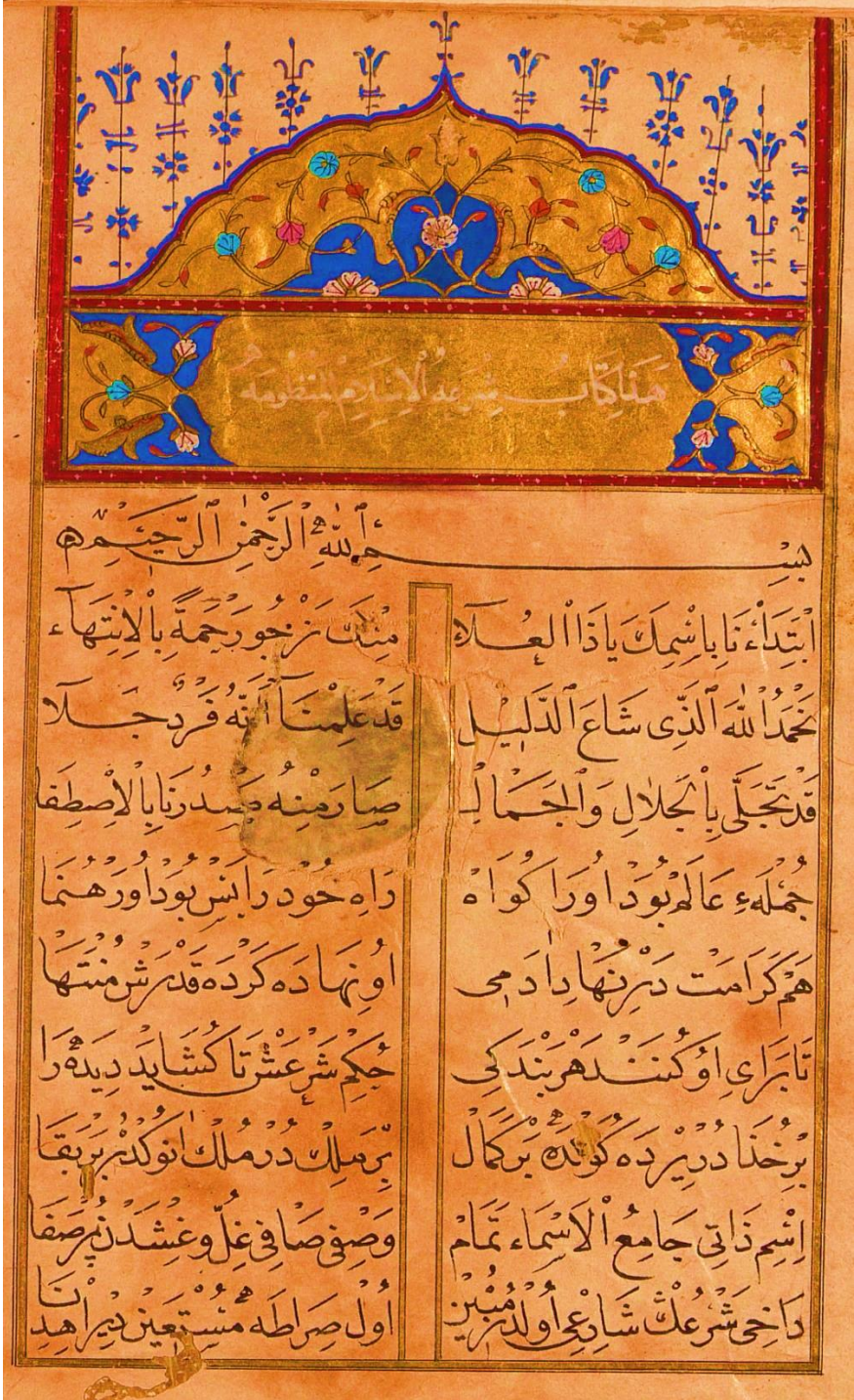
Resim 2: Los Angeles Nūshası 1b sayfası.