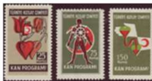
Set of postal tax stamps related to blood donation, issued May 22, 1957 Turkey

http://www.euro.who.int/en/what-we-do/health-topics/Health-systems/blood-safety/country-work/turkey ). The report in this issue by Cantürk et al. (TJPH, Vol 11, No 2, 2013) that addresses volunteerism among blood donors in two (of the nearly 400) blood centers in Turkey is very timely, as is evidenced by a series of papers on ethical and other aspects of offering financial incentives/rewards to blood donors that recently appeared in Science (Lacetera N, Macis M, Slonim R. Economic rewards to motivate blood donations Science 2013; May 24;340(6135):927-8; Berger M. The Value of Incentives in Blood Donation. Science 2013; July 12; 341(6142):128-1290), The American Journal of Bioethics (Petrini C. Medical Philanthropy and Blood Supply in Light of Ethical Documents and Principles. The American Journal of Bioethics 2013; 13:6, 54-55; Sass RG. Toward a More Stable Blood Supply: Charitable Incentives, Donation Rates, and the Experience of September 11. The American Journal of Bioethics 2013; 13:6, 38-45) and Transfusion (Bagot KL et al. Perceived deterrents to being a plasmapheresis donor in a voluntary, nonremunerated environment. Transfusion 2013; 53: 1108–1119).