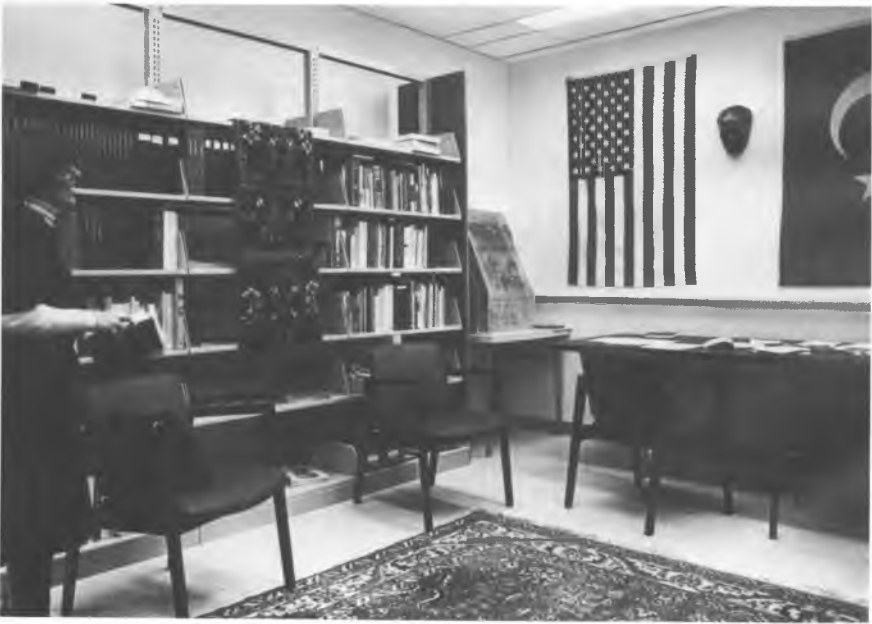
Arşiv'in ana çalışma salonu.