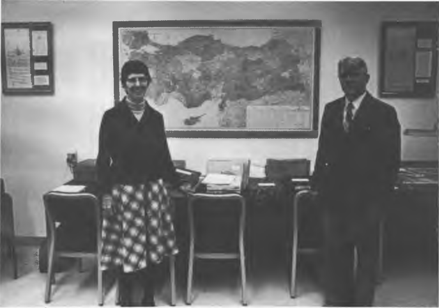
Walker'lar Texas Tech University Kütüphanesi'nde (Archive of Turkish Oral Narrative) Türk Halk Hikâyeleri Arşivi salonunda.