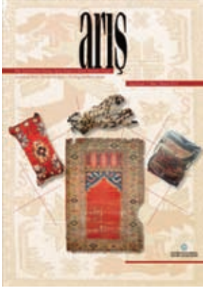
Arış Dergisi, Sayı 7 / Türk Dünyasında Halı ve Düz Dokuma Sempozyumu Özel Sayısı-3, Mart 2012.