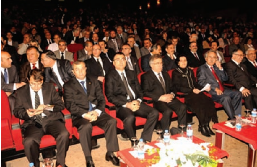
Sempozyum açılış töreninden bir kare