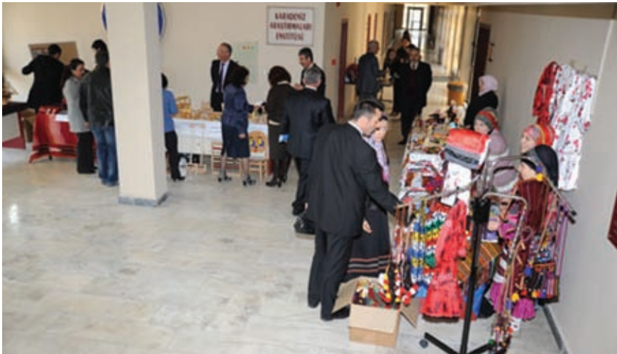
Çalıştayla ilgili olarak açılan ve yöresel el sanatlarının tanıtıldığı sergiden bir kare

Yöresel el sanatlarının tanıtıldığı mini bir serginin de yer aldığı çalıştayda, Merkezimiz ve Karadeniz Teknik Üniversitesi toplumsal ve kültürel meselelerimizin ele alınıp çözümlenmesine öncülük ederek önemli bir başarıya imza attılar.