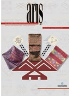
Arış Dergisi, Sayı 6 / Türk Dünyasında Halı ve Düz Dokuma Sempozyumu Özel Sayısı-2, Mart 2011.