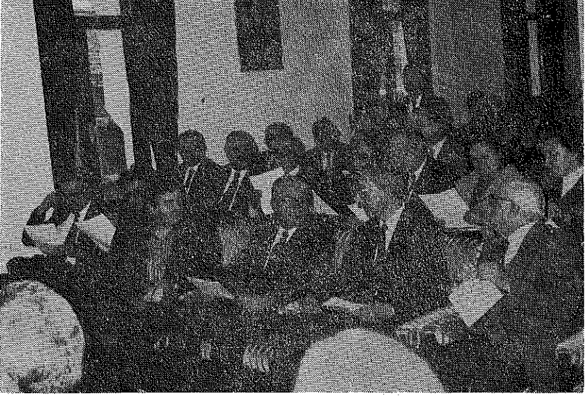
Resim 6. Açılışa katılanlar