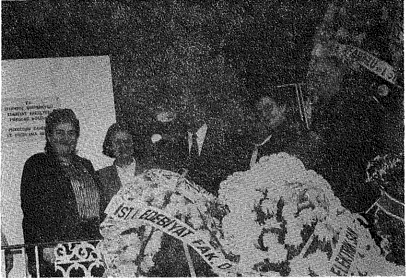
Resim 7. Açılış katılanlar