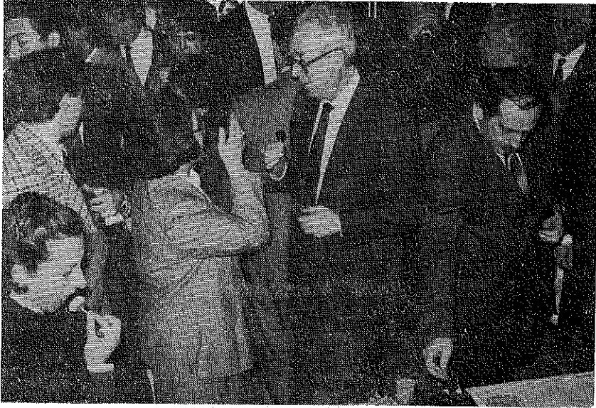
Resim 9. Kokteyl'den görüntüler