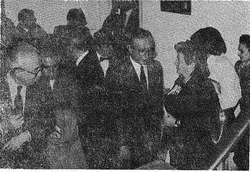
Resim 8. Kokteyl'den görüntüler