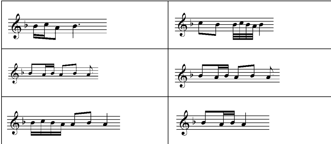
Şekil 1: Kürdi Eserlerde Benzer Yapıdaki Ezgisel Kalıplar

Aşağıdaki şekil cetvelinde Kürdi makamındaki eserlerde ortak olarak kullanılan ezgisel kalıplar görülmektedir. Dügah, Kürdi ve Çargah perdeleri bu ezgisel kalıplar içerisinde kullanılan perdelerdir.