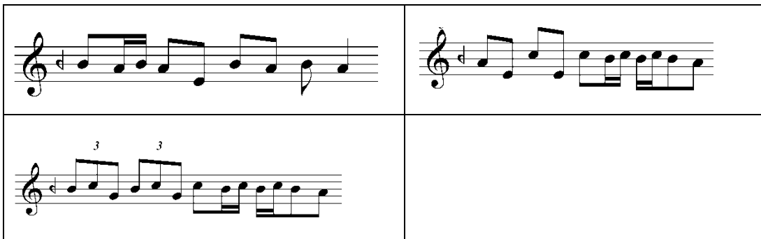
Şekil 3: Karcıgar Eserlerde Benzer Yapıdaki Ezgisel Kalıplar

Aşağıdaki ezgi örnekleri, Hüseyini, Uşşak ve Karcıgar makamlarında 9/8'lik usul yapısında ağır tempoda çalınan eserlerde ortak kullanılan ezgisel kalıplardandır. İcracılar özellikle ağır tempolu eserlerde oyun havasını çalmaya başlamadan önce aşağıdaki ezgisel örnekleri çalarak esere hazırlık yaparlar ve eserin icrasına başlarlar.