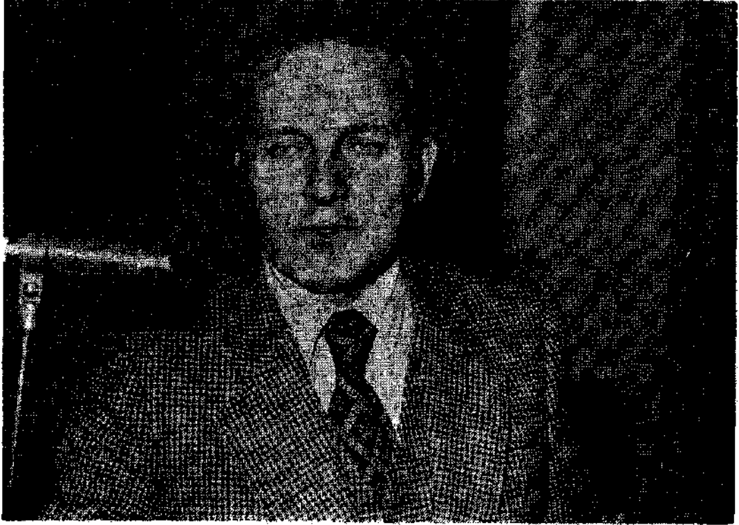
Enerji ve Tabii Kaynaklar Bakanı Erhan IŞIL, Koagre'de yaptığı konuşma esnasında.

Daha sonra kürsüye gelen Enerji ve Tabii Kaynaklar Bakanı Erhan IŞIL, madencilğe ilişkin görüşlerine geçmeden Önce, Meslek Kuruluşlarının toplumsal işlevlerini belirtir konuşması, genelde Teknik Eleman kitlesini, özelde ise maden mühendislerini sevindirici nitelikteydi. Kısaca Meslek Kuruluşlarının, toplumumuzun eko-