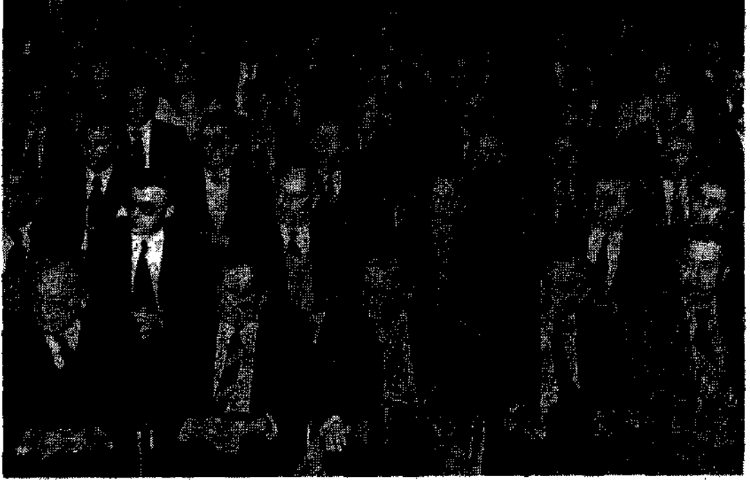
TEKNİK SERGİYİ izleyen konuklardan bir grSfintfi.