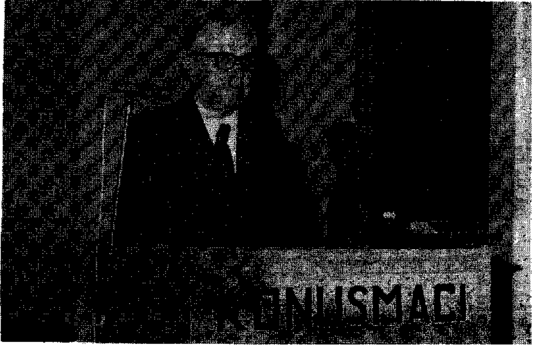
Enerji ve Tabii Kaynaklar Bakanlığı Müsteşarı Tahsin YALABIK, Kongre'de yaptığı konuşma sırasında.

uluslararası işbirliğinin de gereğine inanıyoruz. Ancak bu işbirliğin eşit koşullar altında uygulanması gerekir.