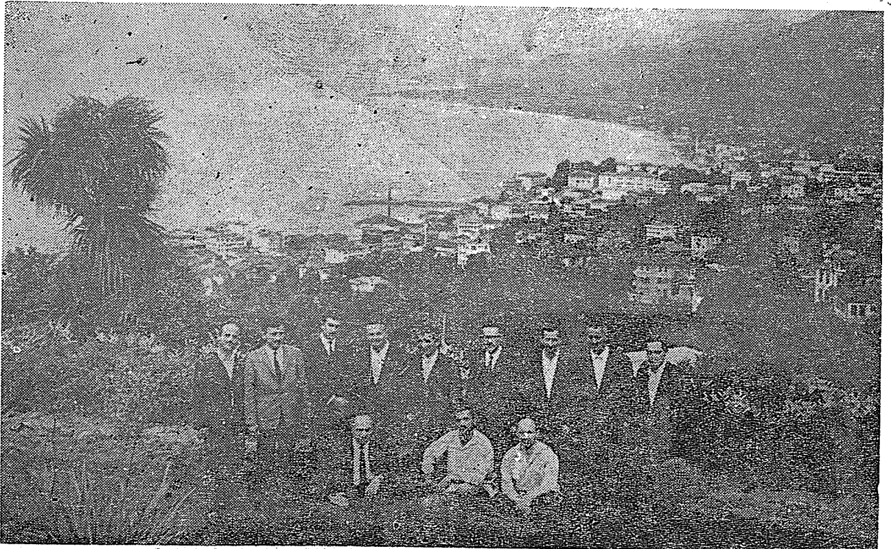
Ekip mensupları Rizeli müslümanlarla bir arada.

Gelecek yıllarda da devam edecek olan «Anadolu'ya Doğru» kervanı, Anadolu'yu adım adım dolayarak bütün müslüman vatandaşlarımızla temas edecek ve Türkiye'nin kalkınmasında büyük bir görev başaracaktır.