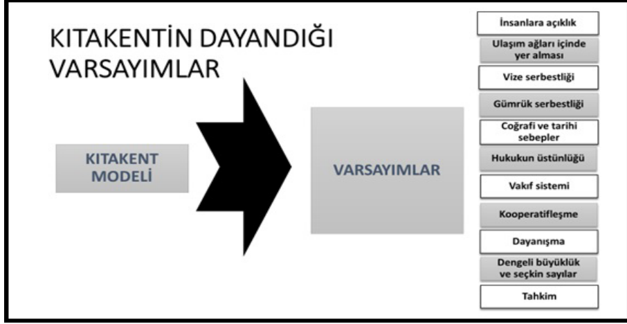
Şekil 2. Kitakentin Varsayımları

Hizmette halka yakınlık ilkesinin ( subsidiarity ) de yaşama geçirilmesi gerekir. Bu ilkenin hem ülkemizde hem de uluslararası alanda benimsenmesi hem gelişme hem de demokratikleşme bakımından son derecede önem taşır. Bunun tersinin düşünülmesi halka ve demokrasiye inancsızlık ve karamsarlık taşımaktan başka anlam taşımaz (Keleş, 1995: 14). Kamusal hizmetler vatandaşa en yakın yönetim birimi tarafından verildiği takdirde etkili olur. Hizmette yerel öncelik ( Subsidiarité/Subsidiarity ) ilkesinde merkez yerel bütünlüğü ve etkinliği içinde yerel halkın istekleri önem kazanır (Toprak, 2014: 39). Bu ilkeler Fransa'da olduğu gibi günümüz anayasalarına girmektedir (Şinik, 2009: 260). Şekil 1'de görüldüğü üzere insanlığı meydana getiren toplumsal yapı oluşturulurken siyasi ve ekonomik olmak üzere ikili bir ayırım önem taşır. Böylece hürriyetle güç göz önüne alınarak hem hürriyetleri esas alan hem de ekonomik olarak güçlülüğü beraberinde getiren dengeli bir hiyerarşik düzen kurulmuş olur. Hürriyetlerle güç dengeli bir şekilde yaplanır.