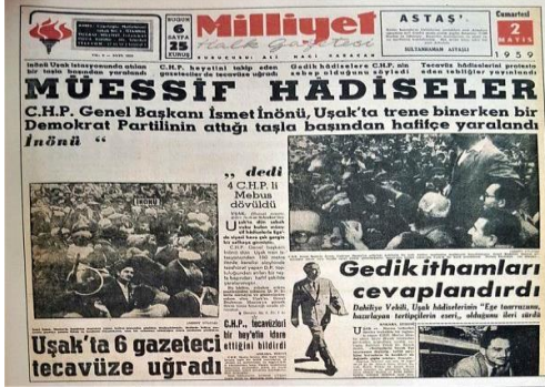
Resim 12. 2 Mayıs 1959, Milliyet Gazetesi

ve muhalefetin keskin çizgilerle birbirinden ayrışarak kanlı hale gelmesine ve hatta vatandaşların da bu kutuplaşmaya dâhil olmasına yol açmıştır.