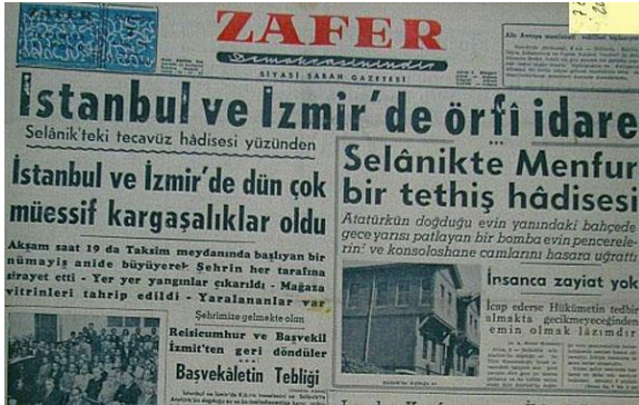
Resim 8. 8 Eylül 1955, Zafer Gazetesi

Olaylar neticesinde Rumlara ait 2200, Ermenilere ait 900, Musevilere ait 400 ve Türk vatandaşlarına ait 400 civarında ev hasar görmüş; zarar görenlere 1957 yılı sonuna kadar 6 buçuk milyon TL tutarında tazminat ödenmiştir. Olaylarda hükumete göre 11 vatandaş hayatını kaybetmiş; 300 ila 600 kadar kişi yaralanmıştır (Aldan, 2012: 73-74).