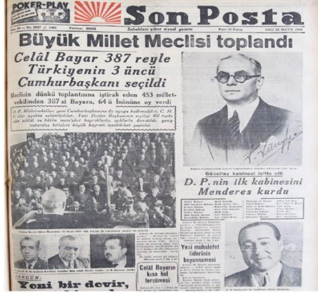
Resim 4. 23 Mayıs 1950, Son Posta Gazetesi

başkanlığına Adnan Menderes getirilmiş; tabii olarak hükûmeti kurma görevi de Menderes'e verilmiştir (Aslan, 2014: 40). 13