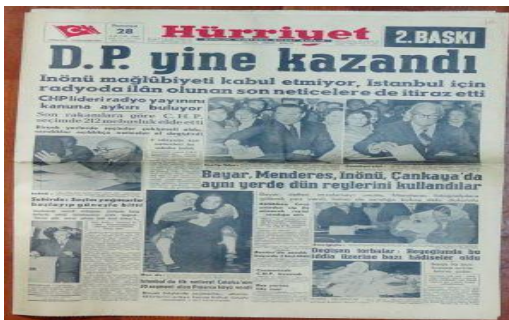
Resim 9. 28 Ekim 1957, Hürriyet Gazetesi