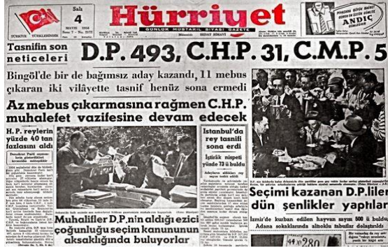
Resim 7. 4 Mayıs 1954, Hürriyet Gazetesi

DP'nin seçimlerden zaferle çıkmasının ardından sıradaki seçimler, Cumhurbaşkanı ve TBMM başkanının seçimine dair meclisteki oylamalar idi. 12 Haziran tarihinde mecliste yapılan oylamalarda Cumhurbaşkanı Celal Bayar ve Meclis Başkanı Refik Koraltan mevcuttaki görevlerine yeniden seçildiler. 23 Bayar, hükümeti kurma görevini yeniden Menderes'e verdi ve Menderes de 17 Mayıs'ta yeni kabineyi açıkladı. 24 24 Mayıs'ta ise yeni hükümet programı mecliste oylamaya sunuldu. Yapılan oylamada 491 olumlu, 2 çekimser ve 27 de ret oyu alan program meclis tarafından kabul edildi ve 26 Mayıs'ta Cumhuriyetin 21'inci, Menderes'in 3'üncü hükümeti fiilen göreve başlamış oldu (Tetik, 2015: 108-109; Tutan, 2018: 137; Küçük, 2013: 133).