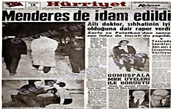
Resim 15. 18 Eylül 1961, Hürriyet Gazetesi

Âdemoğullarından Kabil'in Habil'i öldürmesi nasıl ki insanlık tarihinin ilk büyük günahı ise 27 Mayıs Darbesi de, çok partili siyasi hayattaki ilk büyük günah olarak tarihteki yerini almıştır. Böylece 1950 yılında, öncekilere kıyasla daha adil bir seçimle iktidara gelen ve 27 yıllık kudretli Tek Parti dönemini sona erdiren DP iktidarı, geride bıraktığı 10 yılda demokratikleşmeye ve iktisadi kalkınmaya önemli katkılarda bulunmuştur. İktidarın son yıllarına gelindiğinde ise muhalefet ile yaşanan anlaşmazlıklar neticesinde DP iktidarı antidemokratik uygulamalara ve sert tedbirlere başvururken; alınan her sert tedbir, yeni ve daha sert tepkileri de beraberinde getirmiştir. Menderes, bu kutuplaşma ve kamplaşmada halkı yanında tutmayı başarmış; ancak subayları ve akademi camiasını karşısına almıştır. Nitekim 27 Mayıs'ın fitilini üniversitelerde yaşanan öğrenci olayları ateşlerken, darbeyi de genç subaylar gerçekleştirmiştir. Darbenin emareleri siyasetin çeşitli vechelerinde