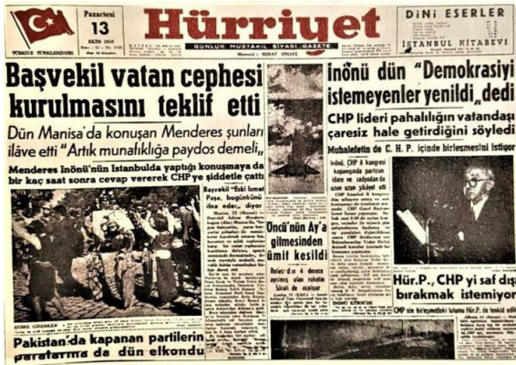
Resim 11. 13 Ekim 1958, Hürriyet Gazetesi