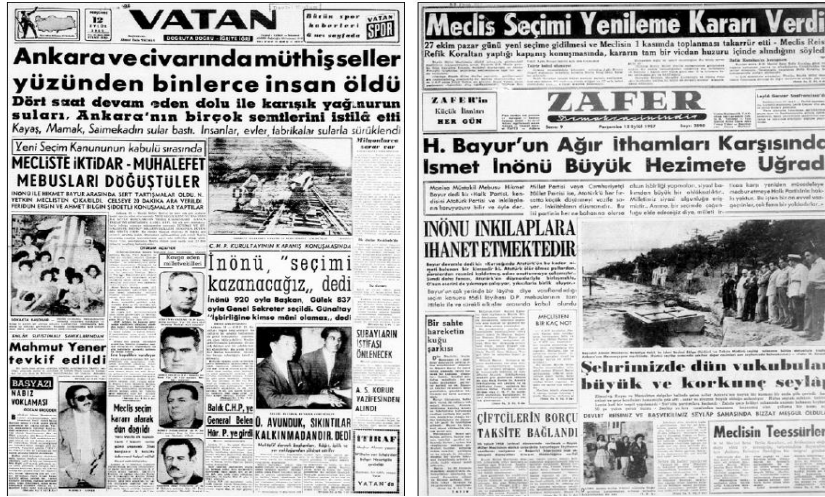
Resim 19-20. Vatan Gazetesi ve Zafer Gazetesi, 12 Eylül 1957