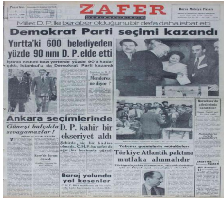
Resim 21. Zafer Gazetesi, 4 Eylül 1950, s. 1.

Mahalli seçimlerin Ankara'daki sonuçları da memleketin genel ekseriyeti gibi DP lehine neticelendi. DP, Ankara'nın yedi ilçesinde belediye seçimini kazanırken CHP, beş ilçede belediyeyi kazandı. DP'nin kazandığı meclis üyeliği sayısı 26, CHP'nin kazandığı meclis üyeliği sayısı ise 16 olarak gerçekleşti (Zafer Gazetesi, 19 Ekim 1950, s. 1).